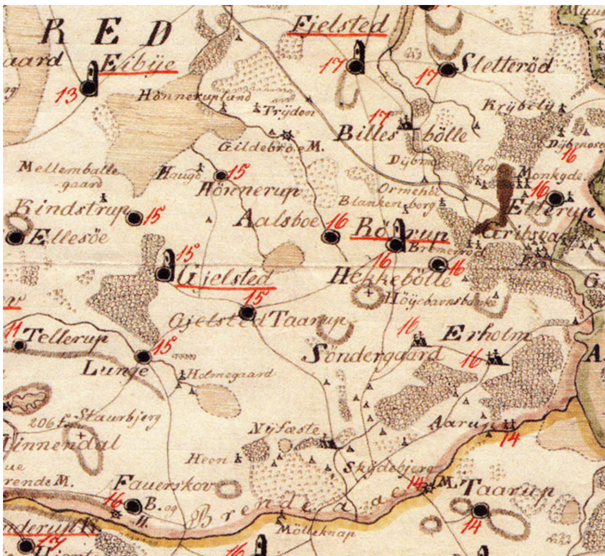
Udsnit af kort over Vestfyn, tegnet af J.P. Aaboe, 1845

Gjelsted Sogn er omgivet mod Nord af Eiby, Indslev og Fjelsted, mod Øst af Rørup, mod Syd af Kjerte og Tanderup, mod Vest af Ørslev og Balslev Sogne. Det er omtrent \frac{2}{3} Miil langt fra Nord til Syd og \frac{1}{2} Miil bredt fra Øst til Vest - en Størrelse og Udstrækning, det upaatviv [//Fol. 4a] leligt har faaet i de 3 sidste Aarhundreder; thi saalangt som de forhaandenværende Efterretninger gaae tilbage i Tiden, findes de samme Byer, ikkun med en noget forskjellig Skrivemaade, nævnte som endnu ere til og der er Intet forekommet mig der kunde hentyde paa