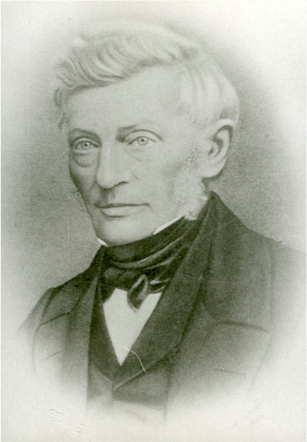
M.G. Krag (1794 – 1864)