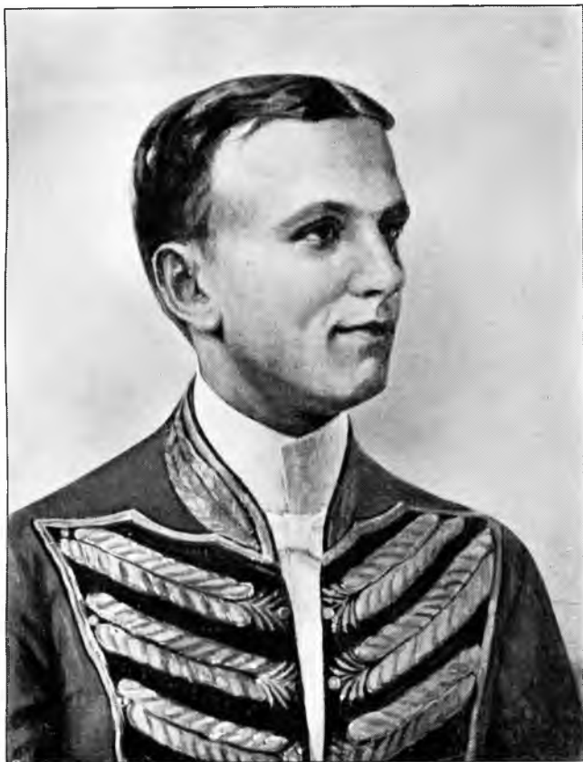
WENTZEL OLUF VILHELM DINESEN