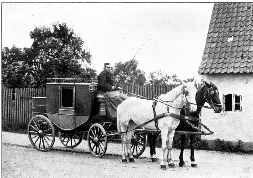
DILIGENCEN NYSTED - NYKØBING.

Selv om Nysted endnu ikke fik sit Ønske om direkte Jærnbane-forbindelse med Omverdenen opfyldt, kunde det dog ikke undgaas, at Baneanlægene paa Lolland-Falster maatte udøve en kendelig Indflydelse ogsaa paa Trafikken her i Byen. Beliggenheden blev mindre afsides; det