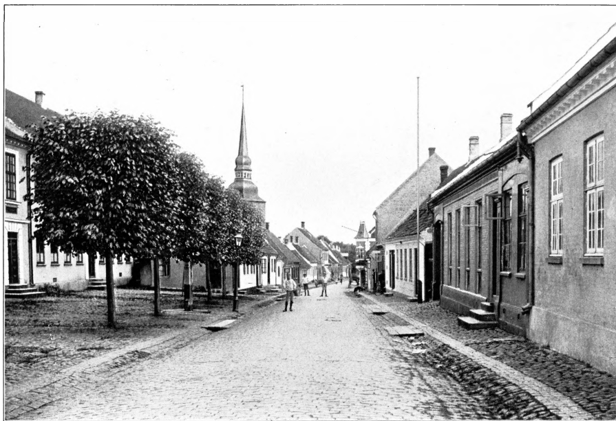
PARTI AF ADELGADE I NYSTED.

Men er Byen fattig paa Mennesker, saa er den derimod rig paa Jord. Dens Grund udgør henved 1000 Tønder Land, nøjagtig 983, hvoraf 49 Bygrund og 934 Markjorder . Den staar her i Stiftet kun tilbage for Rødby*), der har det kolossale Areal af næsten 5000 Tdr. Medens der i Danmark gennemsnitlig falder 1\frac{1}{5} Td. Land paa hver Købstadejendom,