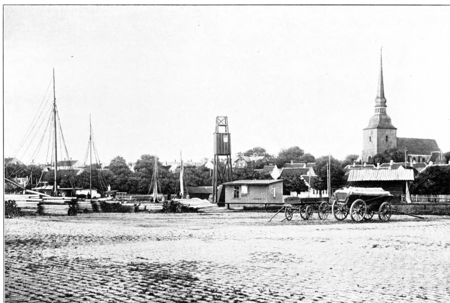
NYSTED SET FRA HAVNEPLADSEN.

Adgangen fra Sø siden har ogsaa sine Mangler. Det volder „Rødsand“, det 3 \frac{1}{2} Mil lange Rev, der i omtrent 1 Mils Afstand fra Land, i en svag Bue fra V. til Ø. strækker sig fra Hyllekrog tæt ind til Sydspidsen af Falster. Omtrent lige Syd for Nysted er det afbrudt af et \frac{1}{2} Mil bredt Sejlløb, delt i de saakaldte „Vestre“- og „Østre-Mærker“, hvoraf det sidste har en Dybde af ca. 8 Fod. Større Fartøjer maa styre igennem Kroghaveløbet imellem Grunden og Falster. Indenfor Revet er