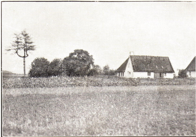
Billede fra Klippede: Den tregrenede Gran.