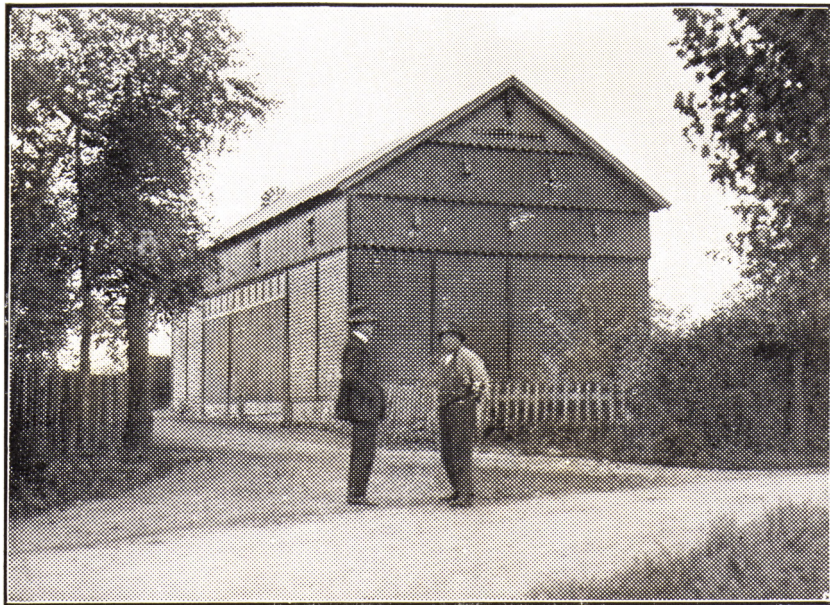
Billede fra Klippede: Lade bygget af Fr. Jensen uden fremmed Hjælp 1926.