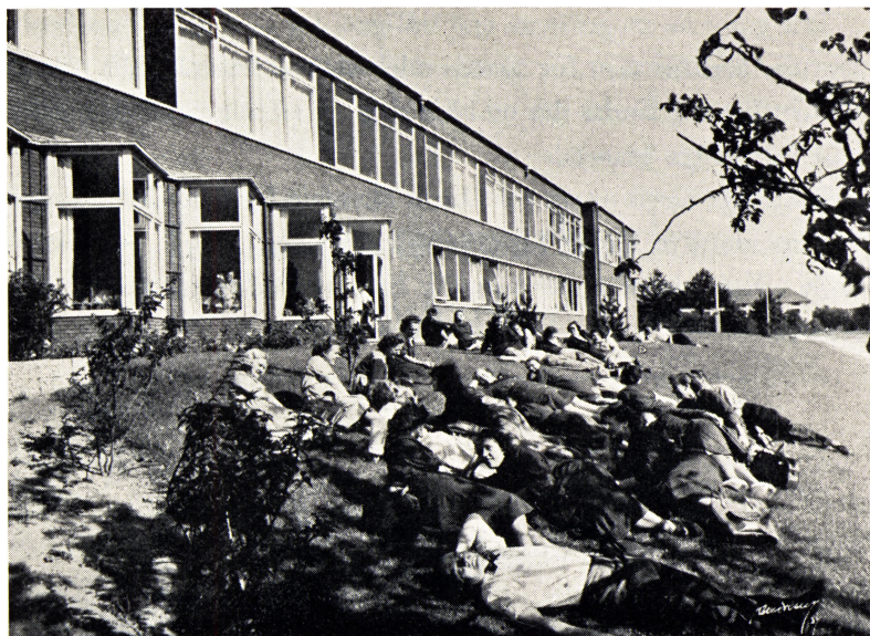
En hvilepause i det grønne.

Ved forhandling med Københavns magistrat mødte udvalget megen interesse og forståelse for tanken, og borgerrepræsentationen vedtog, at der inden for et nærmere fastsat tidsrum kunne stilles areal til rådighed ved Lersø Parkallé til opførelse af nogenlunde ensartede og efter moderne principper anlagte fabrikker.