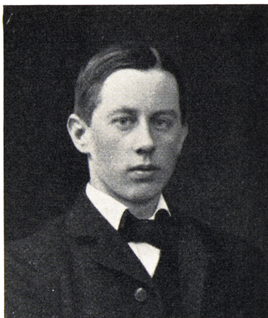
Mig selv som ung svend (1904).

Grundet på den store tilslutning, deltes foreningen op i flere lokal-afdelinger med en fælles ledelse, som jeg en tid var formand for. Uden tilskud fra nogen side udførtes et stort oplysningsarbejde. Der blev afholdt møder, fester og bazarer mod en lille entre, for at skaffe penge til en læsestue, som blev indrettet i en to-værelseslejlighed i en baggård i Thuresensgade.