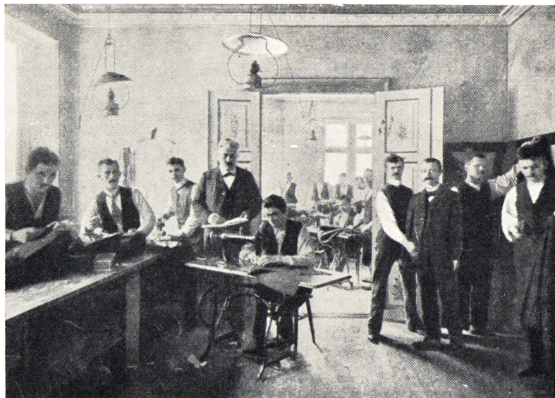
Skrædderværksted Laksegade 16, København 1910. Et af de værksteder Dansk Skrædderforbund oprettede i begyndelsen af århundredet som et led i kampen mod hjemmearbejdet.

Under laugsvæsenets traditionsbundne forhold skred udviklingen kun langsomt frem, men befolkningstilvæksten og de mange opfindelser i det 18. århundrede sprængte det gamle laugssamfunds rammer.