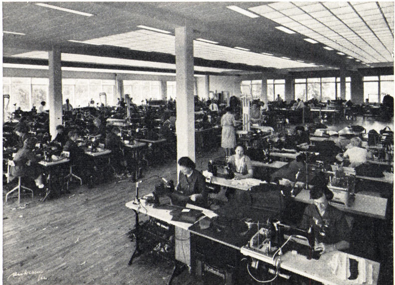
Interior fra Brdr. Andersens fabrik i konfektionsbyen.