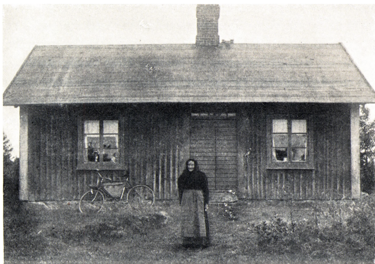
Mit barndomshjem i Lousbult og min gamle faster (1917).

indtil hun bogstavelig talt visnede bort og døde efter 36 års sygdom, da hun var midt i halvtredserne. Jeg tror aldrig, noget menneske med større tålmodighed end hun havde, har båret sygdommens tunge byrde.