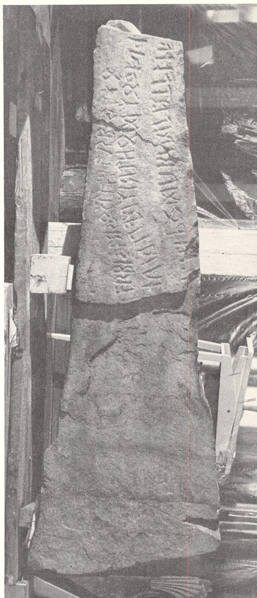
Fig. 2. Tunestenen. Side B med rejser- og gravølsindskriften. Aslak Liestøl fot. 1982.

des det dels frihåndshugningen, dels – og først og fremmest – sidens bredde, og den store afstand mellem højre linje og midtlinjen skyldes næppe, at risteren har villet markere et nyt afsnit her. Det er ikke den måde, risterne