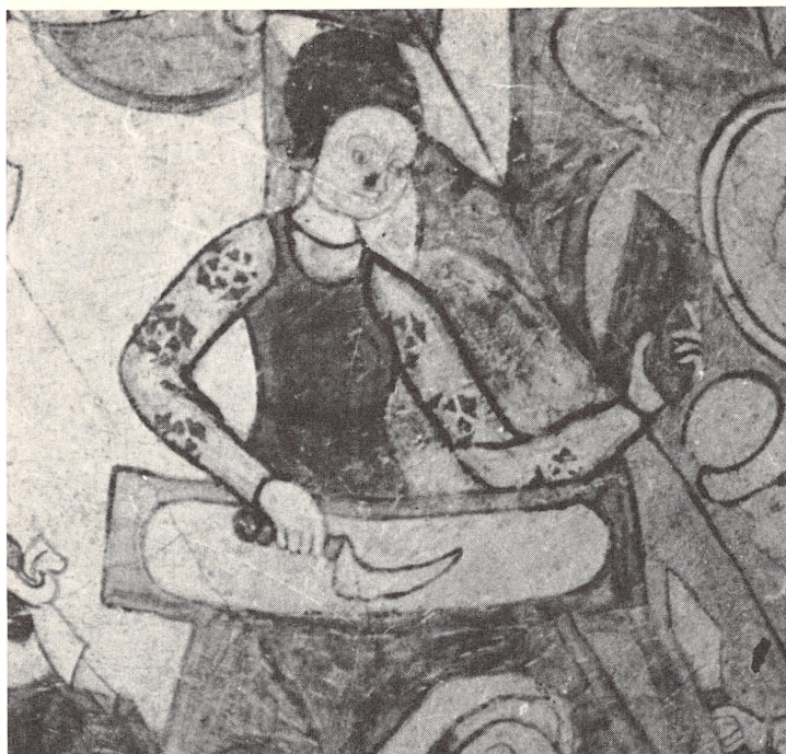
Udsnit af kalkmaleri fra Brunby Kirke (Malmöhus Län) der forestiller St. Andreas under en prædiken for bygningshåndværkere. Bag murermesteren står en »murerarbejdskvinde«, der rører mørtel og er parat til at række ham en ny forsyning. Skriftlige kilder vedrørende ufaglærte kvinder på byggepladserne i middelalderen findes ikke fra Danmark men kilder fra udlandet omtaler disse kvinder. Nationalmuseet 2. afd.

der var både mere synlig og mere anset end i dag. Som det udtrykkes i Slesvig slagterlavs skrå fra 1421, så skulle der i slagterhåndværket i byen være »otte uberygtede, hæderlige mænd, ægtefødt som det er foreskrevet, deslige deres hæderlige, ægtefødte hustruer.« 31 Også de mange påbud om at kvinder, der giftede sig med mestre, skulle være »faget værdigt« vidner om mesterkonens betydning for håndværksklassen.