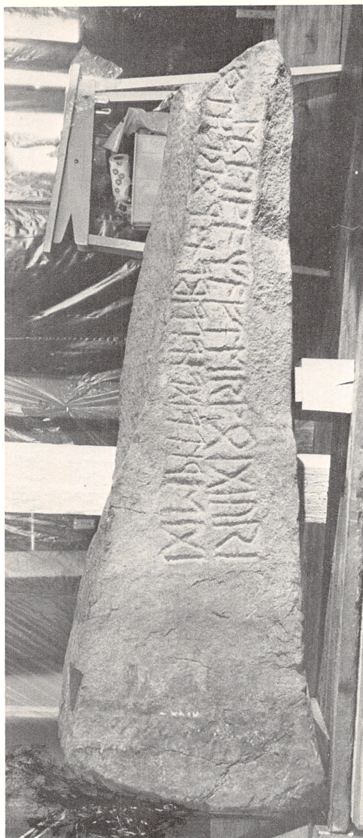
Fig. 1. Tunestenen. Side A med runemesterindskriften. Stenen, der beror i museet på Bygdøy, er fotograferet (med projektor) i liggende stilling. Fotografen er Norges førende runolog, Aslak Liestøl, som med enestående kollegial velvilje har stillet denne og de følgende nyoptagelser til rådighed for forf. af nærv. artikel. Varmt tak.

des det dels frihåndshugningen, dels – og først og fremmest – sidens bredde, og den store afstand mellem højre linje og midtlinjen skyldes næppe, at risteren har villet markere et nyt afsnit her. Det er ikke den måde, risterne