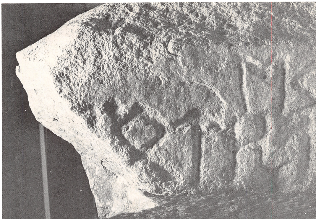
Fig. 3. Tunestenen. A-sidens top. Fotografiet – med skrålys – viser brudfladen efter det forsvundne topstykke samt den sikre runerest efter o-runen og skillepunktet. Tilstedeværelsen af skillepunktet antyder i øvrigt, at indskriften ikke slutter med o-runen. Jfr. skillepunktet efter staina på side B fig. 2.

runor og opfatte det som objekt for worahto. Første linje betyder da: Jeg Wiw efter Wodurid brødgiveren virkede runer.