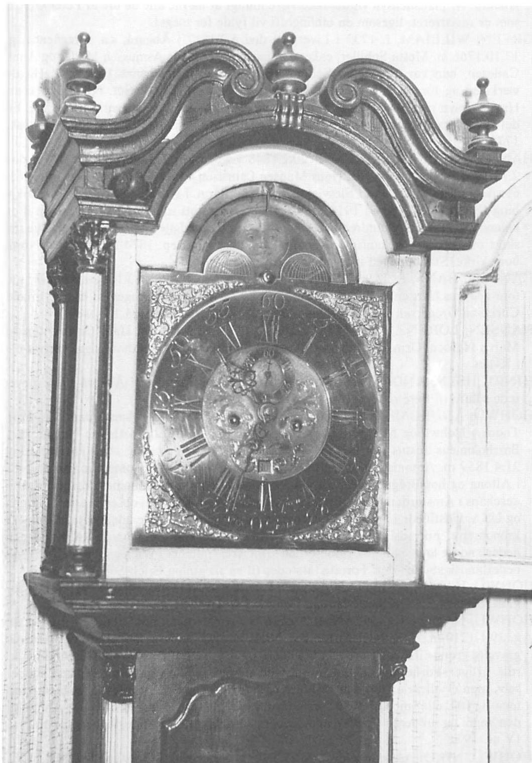
Kunst-ur fremstillet af Peter Green, Åbenrå. Står i dag i Hjallerup Møllegård i Vendsyssel.