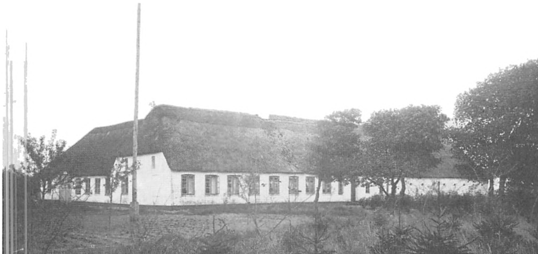
Gården »Frifelt«, Alslev. Opført 1769. Fotografi fra ca. 1921. Ejendommen er stort set uforandret i dag.