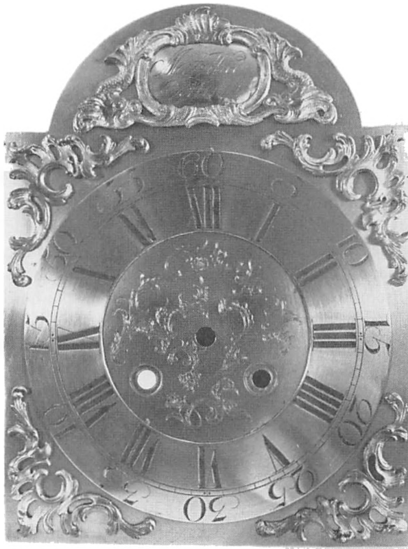
Urskive med typiske rokoko-motiver. Uret er fremstillet af Matz (Mads) Wied, Åbenrå. Privat eje.