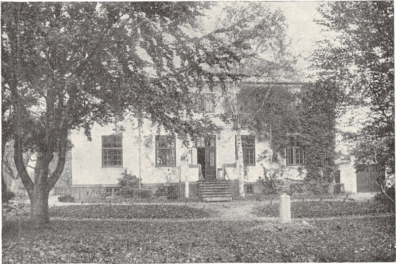
Kredslæge Lemches Bolig (set fra Haven).

fra ca. 60 til vistnok over 200, og det gav jo et ret solidt Rygstød for videre Foretagender. Af Planer, vi syslede med, kan jeg nævne een, som gik ud paa at føre en Viadukt under Jernbanelinien fra Sorgenfri Sidevej til den vestlige Side af Jernbanevolden og i Foden af dennes vestlige Side at danne en Sti, der kunne bringe lysthavende ad denne Vej over til Prinsessestien. Jernbaneledelsens Tilladelse hertil var givet, men saa blev jeg Medlem af Sogneraadet, og Sagen faldt hen,