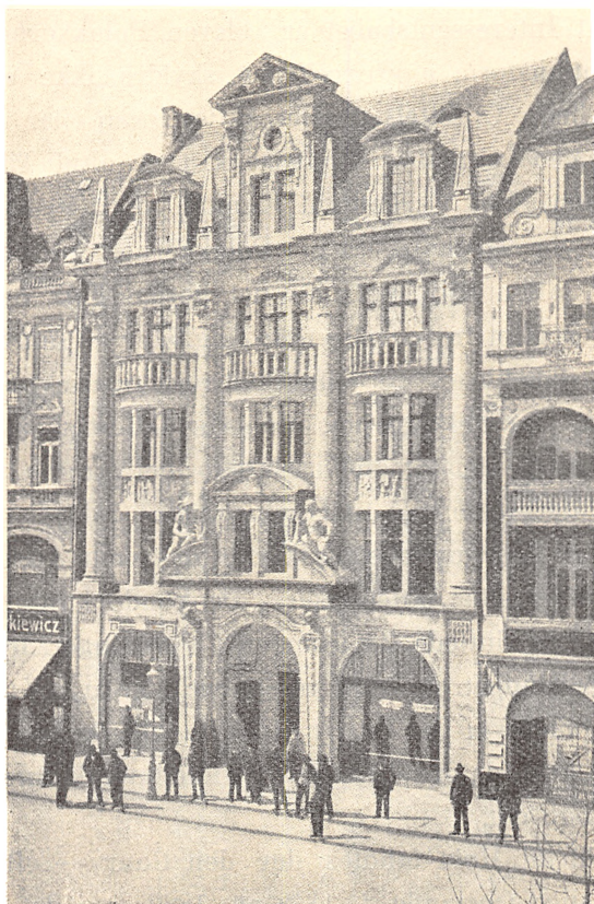
Haandværkerbanken i Posen.

genger lykkedes over Forventning, blev Tanken i 1870-erne overført til Landbruget, hvor den ogsaa slog an. De spredtliggende Andelskasser blev i 1872 samlet i et Revisionsforbund, i 1886 — Aaret for den første