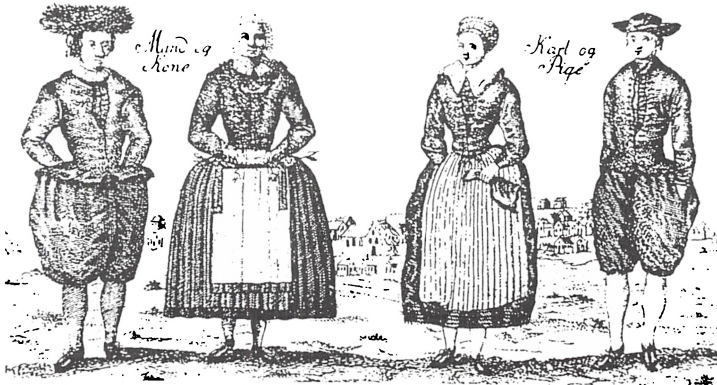
En gammel gengivelse af typiske dragter fra Amager

I slutningen af 1800-tallet gik det stærkt tilbage for Dragør på grund af sejskibenes ophør. De moderne dampskibe udkonkurrede Dragørs gamle sejskibsflåde og bevirkede tillige en tilbagegang for lodseri og bjergningsvæsen. I dag har søfarten ingen betydning for Dragør, udover at færgen fra Limhamn i Skåne giver livlig handel i byen. Der kommer altså stadig skåninger til Dragør, men nu på returbillet.