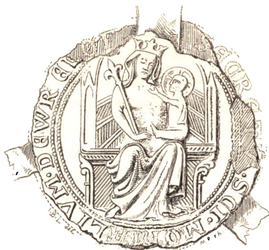
Vreilev Kloster-Segl benyttet i Aaret 1335.

O mtrent halvanden Mil sønden for Hjørring oppe paa et jevnt skraanende Bakkedrag ligger Hovedgaarden Vreilev Kloster. Da de omkringliggende Egne ere flade og sparsomt bebyggede, drages Blikket allerede i lang Afstand mod dens anselige Bygninger, hvis hvide Mure og teglhængte Tage rage op over den Skare Træer, som have søgt Beskyttelse her mod Vestenvindens knugende Haand.