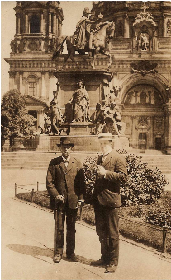
Forfatterens farfar og far foran domkirken i Berlin. Begge Berlin-billeder formentlig fra 1921.