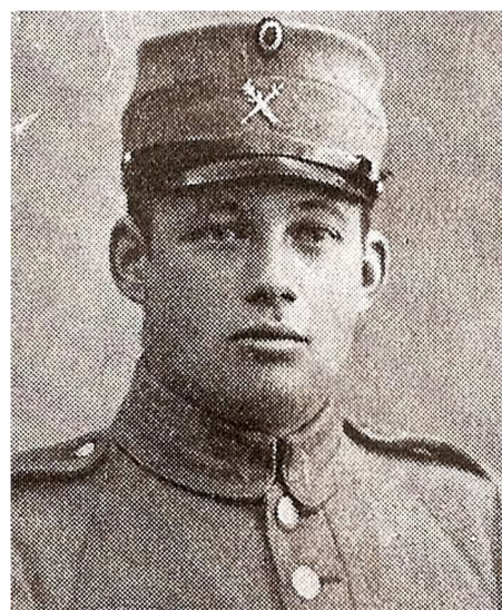
Min far, formentlig 1922.

Ubrugte rationeringsmærker efterladt af min far.