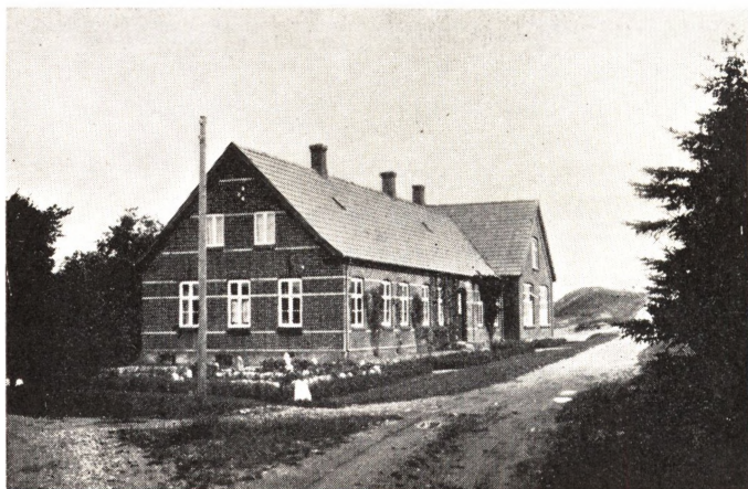
Ingstrup nye Skole.