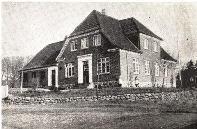
Lærerboligen i Løvel