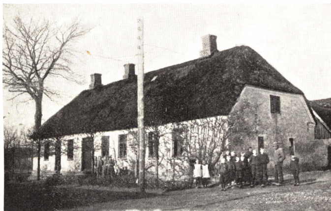
Løvel gamle Skole.