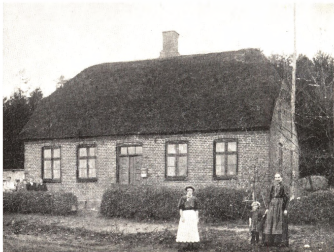
Kistrup gamle Skole.