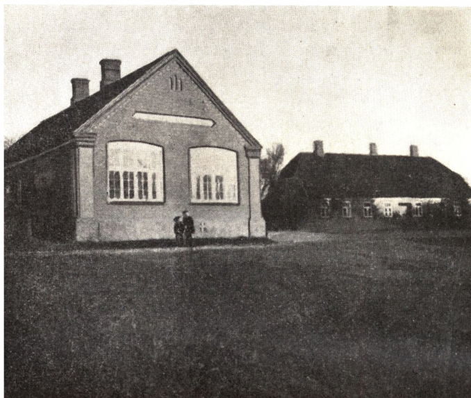
Den gamle og nye Skole i Rødding.