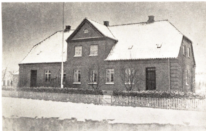
Lærerboligen i Rødding.