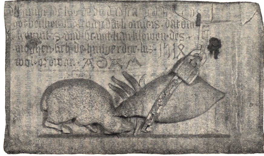
Fig. 2. Västra gavelhällen å brunnskaret i Lunds domkyrkas krypta.

Hvilken ståndpunkt mästern Adam, som å brunnskaret