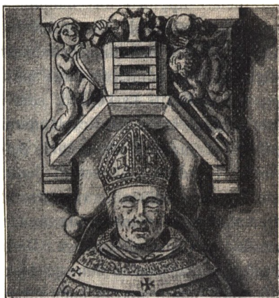
Fig. 3. Från ärkebiskop Birgers grafmonument i Lunds domkyrkas krypta.

På västra sidan af den kraftiga stråfpelare, som från sydost anslöt