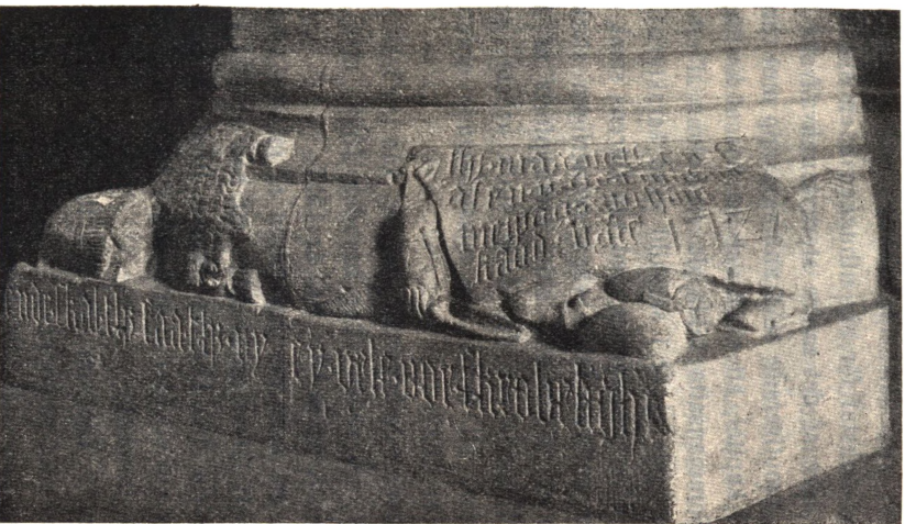
Fig. 6. Skulptur å kolonnbas i Lunds domkyrka.

försedd med en hålkål uppill. Midt på densamma är en sköld anbragt i relief, och på denna är ett halster utbugget. Det är naturligtvis konstnärens märke. Detta tyckes strida mot antagandet, att van Düren varit upphofsmannen, ty det