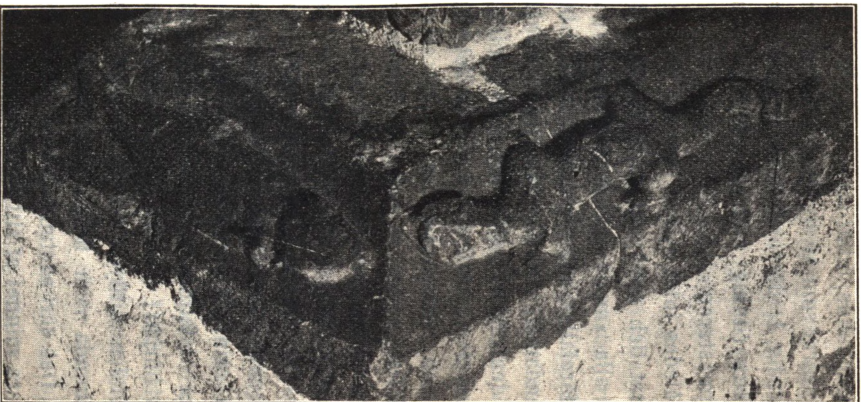
Fig. 1. Detalj från spisel å Glimmingehus.

sträfpelaren vid domkyrkan och en liknande å den nu nedrifna predikstolen, som haft sin plats på Krafts kyrkogård här i Lund. Den i samma rum som korsfästelsereliefen å