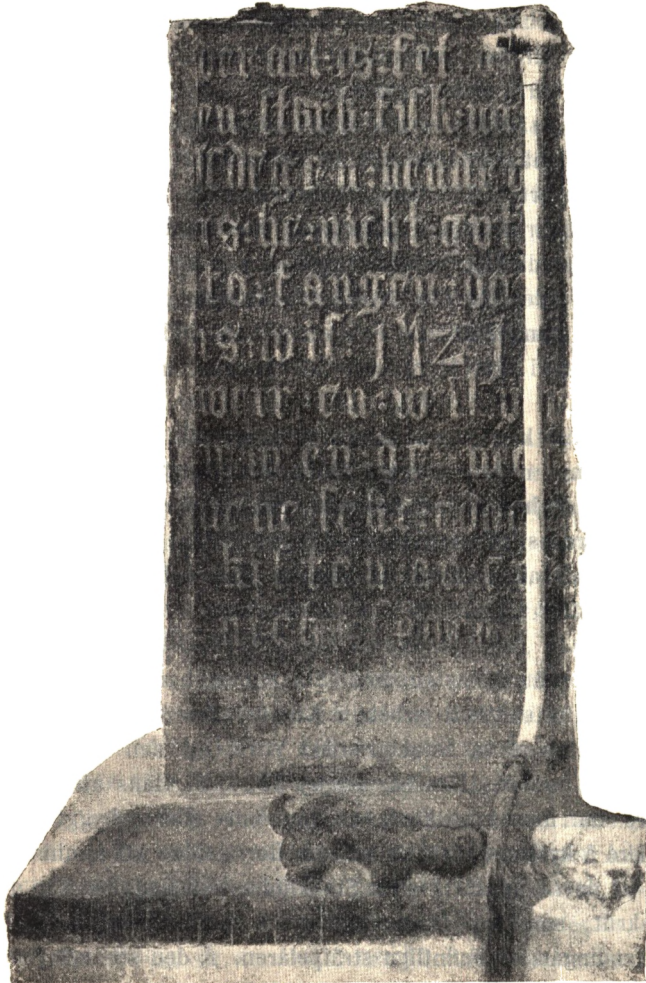
Fig. 4. Skulptur i Stockholms Storkyrka.

Fyndet af en bulla från tiden o. 1500 under en af sträfpelarne på norra sidan tyckes visa, att van Düren äfven