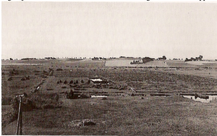
Gammelt fotografi taget fra huset i bakkene ud over Ellemosen.

Far fik tidlig bygget et værksted, som han ønskede at indrette som smedie. Det var en kvadratisk lille bygning med lave mure, således at det røde tegltag var løftet i en bue over døren. Der var skorsten i det nordvestlige hjørne. Skorstenen havde åbne sider og var lukket i toppen, og