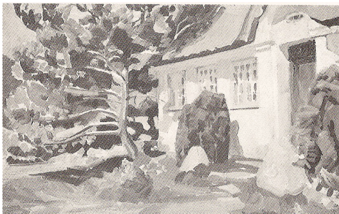
Johannes V. Jensens hus i Tibirke Bakker malet af Fritz Syberg under et besøg i sommeren 1929.