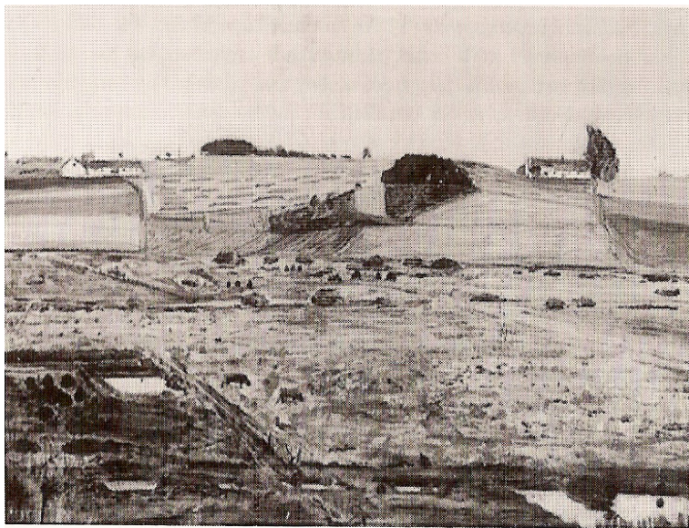
Johannes V. Jensens maleri af næsten samme udsigt over Ellemosen.

herunder sad i mange år en ugle og gemte sig om dagen.