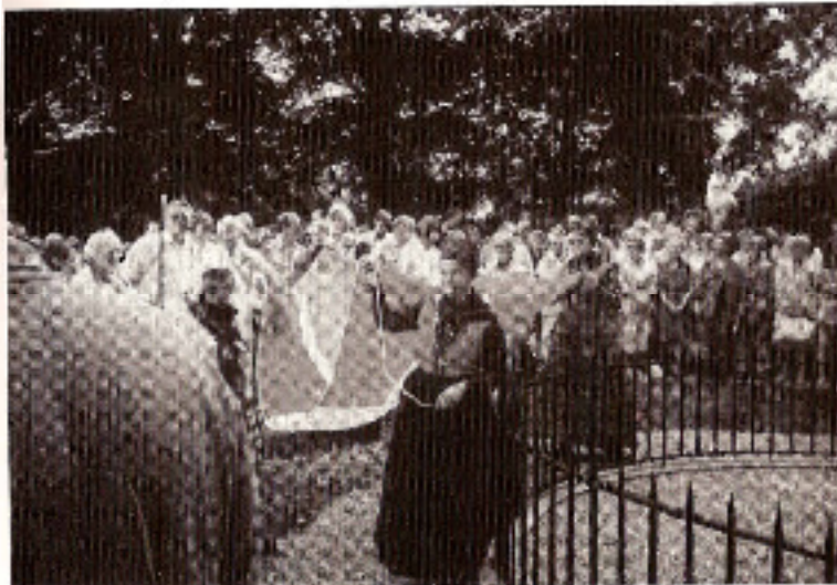
Ved sandflugtsmonumentet 24. juli 1988. Folkedansere bærer flaget frem - en gave fra Vejby-Tibirke selskab