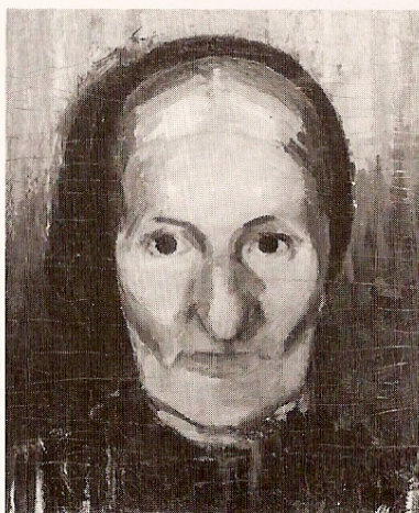
William Scharff: »min mormor (II)«, 1908.