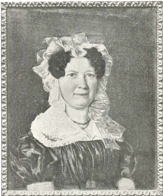
Frederikke Eleonore, f. 1781 1)

Hvidt og Drewsen talte imod den, og da det kom til Afstemning var kun \frac{2}{5} af Forsamlingens Stemmer for den; den faldt altsaa.