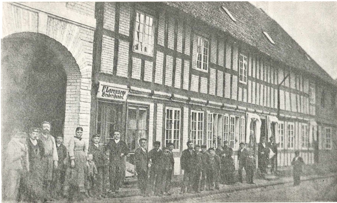
En Del af den gamle Fædregård i Faaborg. (Efter et ældre Fotografi)