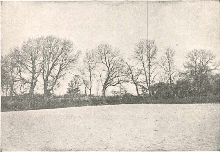
Fig 3. Bellinge gamle Borgplads*)

Christense Kruchov slap vel dengang nogenlunde fra Sagen, men 1621 blusser Processen op paa ny, og da maatte Christense følge Heksenes Vej, Baaldøden.