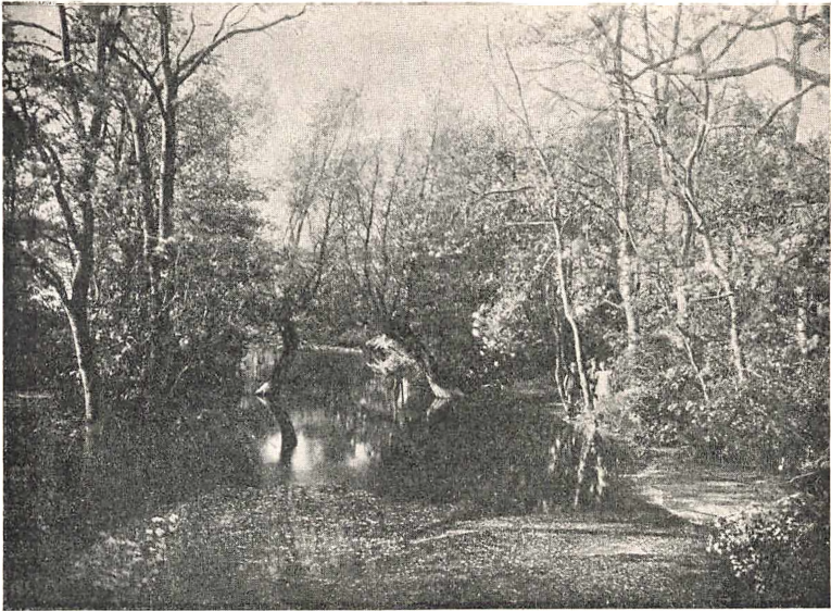
Fig. 7. Parti af Torkildstrupgaards gamle Volde og Grave.

Rester af Torkildstrupgaards Volde og Grave ses endnu, og Suset i de gamle Træers Kroner vil forhaabentlig endnu i mange Aar melde om Slægterne Venstermands og Sparres Glansdage.