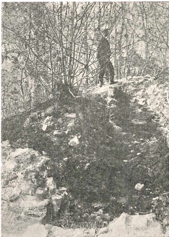
Fig. 6. Ruiner fra Bønnet.

nerslund), og efter at den daværende Ejer, Morten Venstermand, den 18. Nov. 1570 havde tilbyttet sig 4 Bøndergaarde, mageskifter han 22. Juni 1575 med Kronen, og faar for Egebjerg Gaard og By, som er 8 Gaarde, Krønge Gaard og Birk paa Lolland.