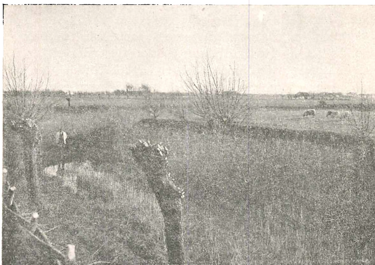
Fig. 2. „Svinehave Borgsted“ ved Gedser paa Falster*). Paa Billedet ses et Hjørne af den firkantede Tomt, omgivet af brede Voldgrave. — Efter al Sandsynlighed var det Valdemar Sejrs gamle Kongsgaard, som laa her.