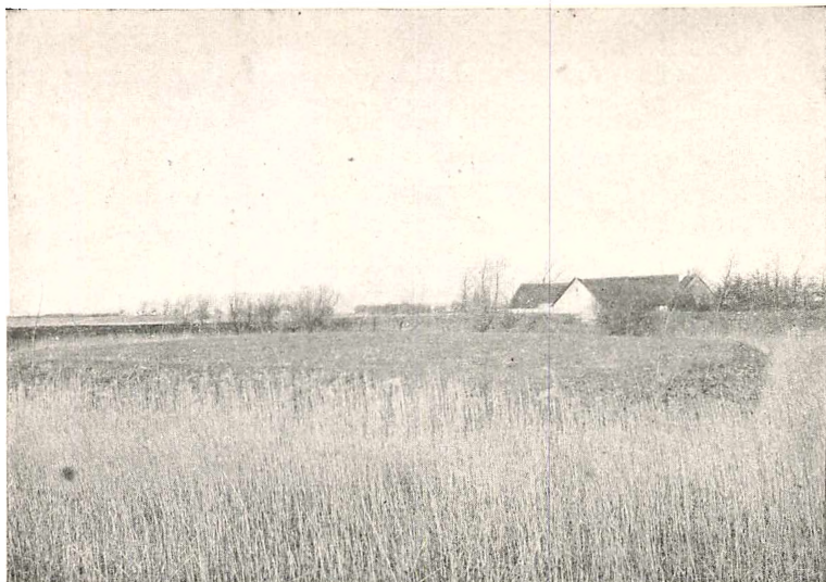
Fig. 1. „Svinehave Borgsted“*). Den firkantede Flade er Borgens Tomt; udenom findes de rørbevoksede Voldgrave.