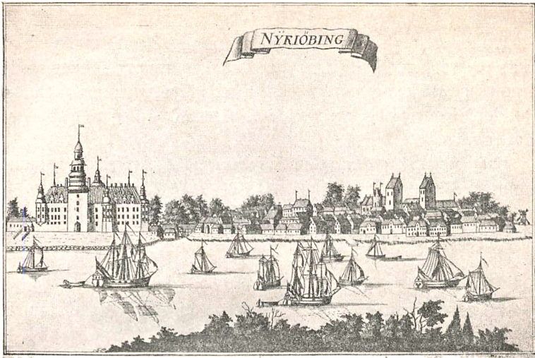
NYKØBING efter „Danske Atlas“ 1767.