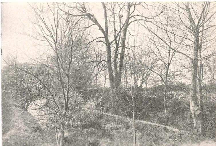
Fig. 4. Bellinge gamle Borgplads med Graven mod Vest.

Strid med Fyns Biskop, Jens Andersen Beldenak, som ofte boede paa Sørupgaard i Eskildstrup Sogn, da denne Gaard hørte under Bispestolen i Odense. (Lolland-Falster hørte under Fyns Stift til 30/12 1803).