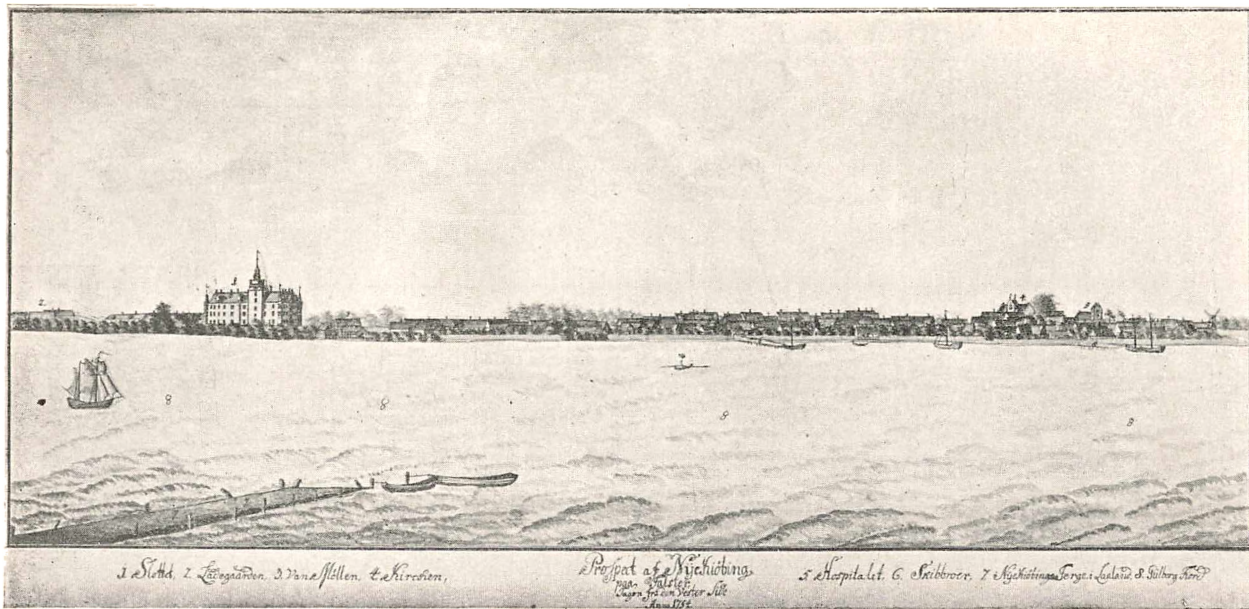
NYKØBING PÅ FALSTER 1754. Efter „Frederik den V's Atlas“ i Kgl. Bibliotek.