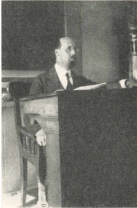
Olaf Kejser paa Katederet 1920.