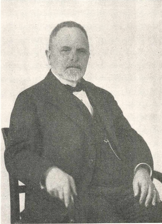
Fot. o. 1930.