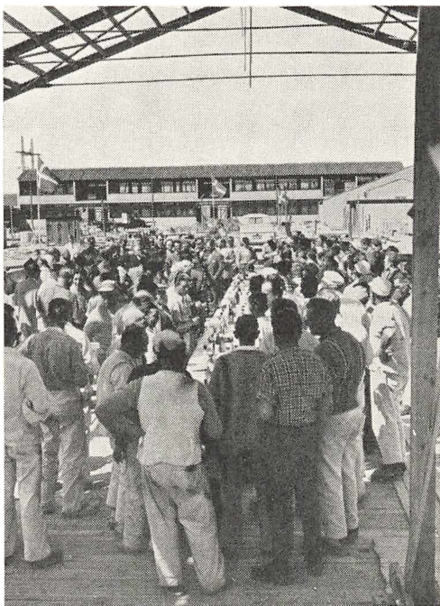
Fra rejsegildet den 23. maj 1959.