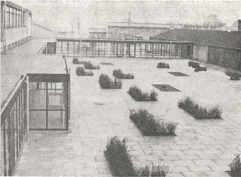
Det nye Jonstrup.