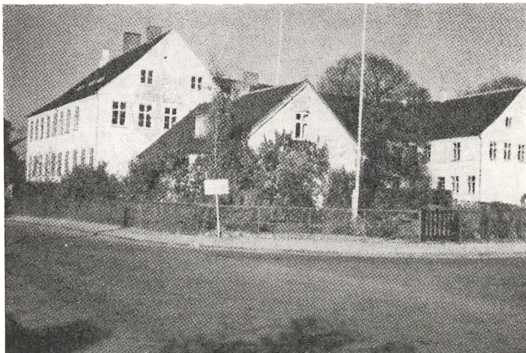
Det gamle Jonstrup.