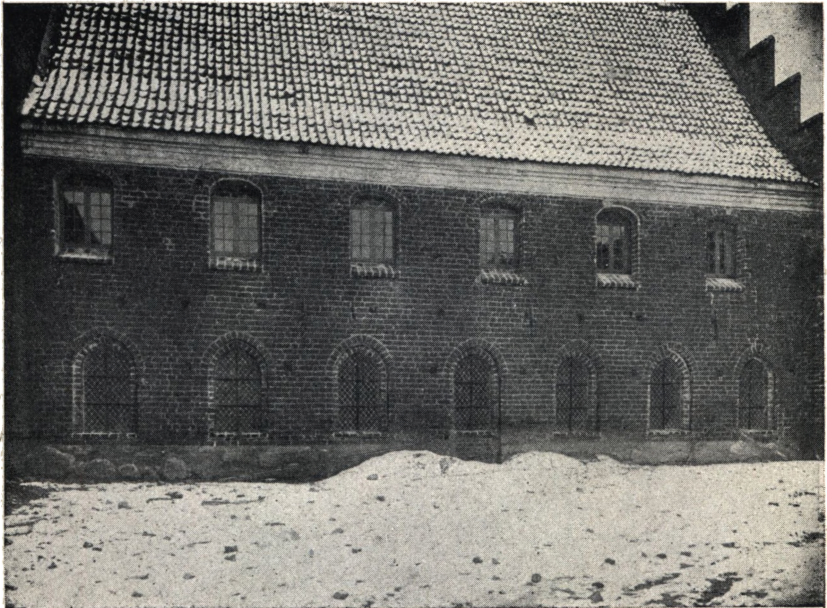
Afb. 3. Vestfløjens Østside efter Istandsættelsen.

Vinduerne med Ruder af raat hamret Glas, og i samme Række til højre de to genaabnede Vinduer, som havde været tilmurede i den Tid, da Rummet indenfor tjente til Fange-celler, af hvilken Grund de ikke er til Syne paa Afb. 2 i Aarb. 1917. Hele Vinduesrækken førtes nu tilbage til sit oprindelige Udseende, hvad Afb. 3 udviser. De store „Is-