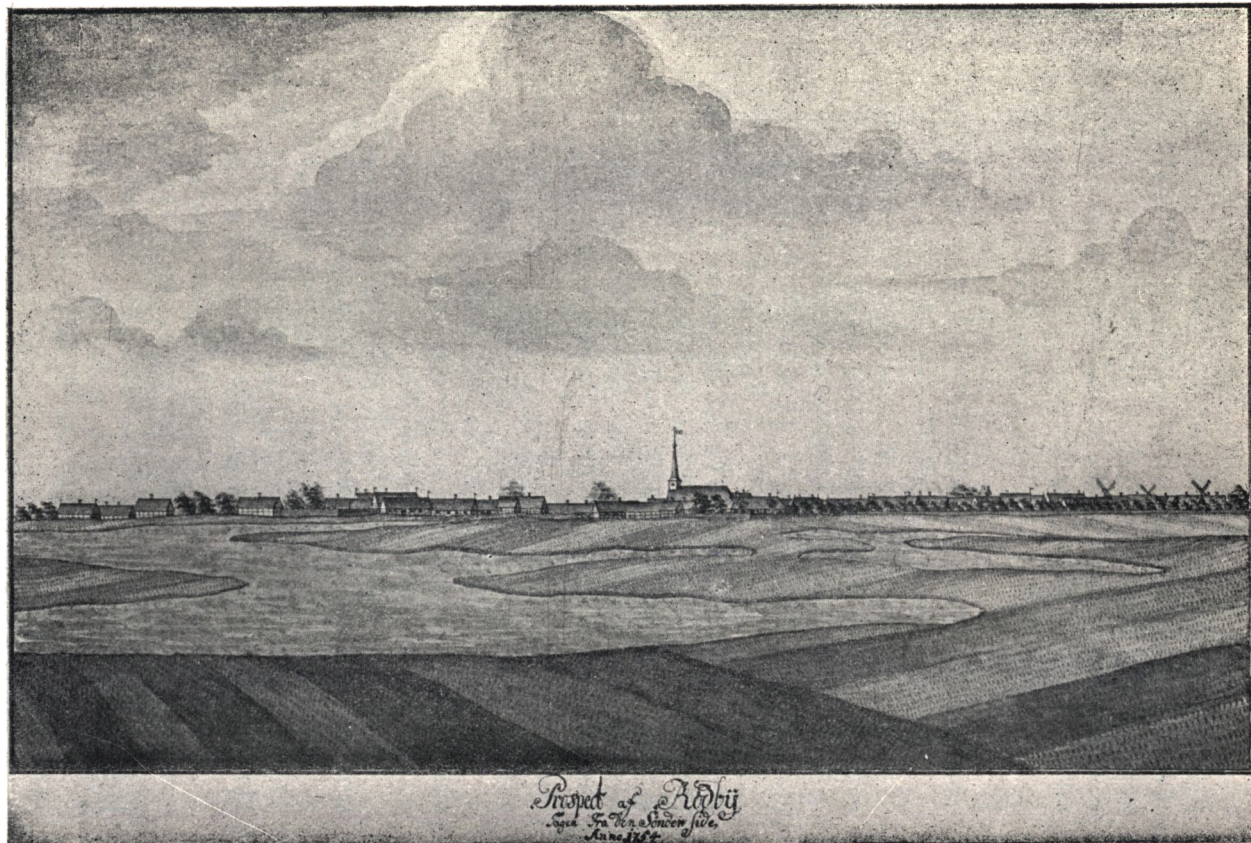
RØDBY 1754. Efter „Frederik den V's Atlas“ i Kgl. Bibliotek.