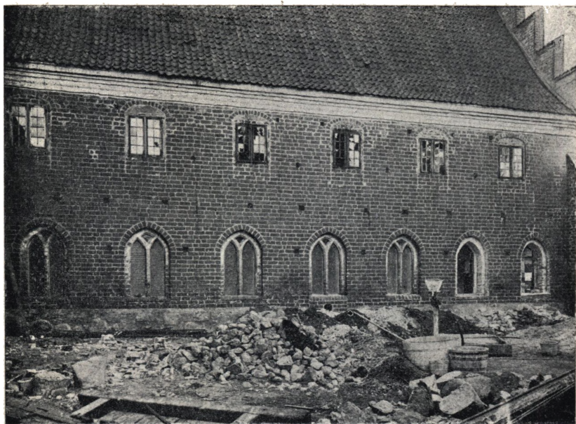
Afb. 2. Vestfløjens Østside under Istandsættelsen 1901.

Her foreligger et godt Eksempel paa, hvor haardt der maa bødes for ældre Tids Mangel paa Fremsyn; Byen kunde