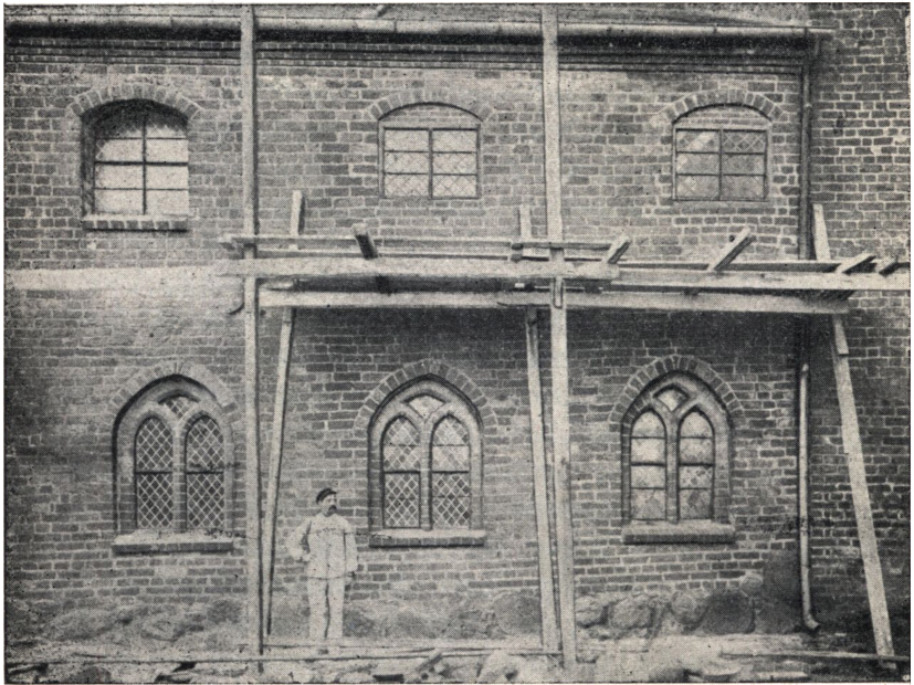
Afb. 1. Sideskibets Nordside under Istandsættelsen 1901.

Kirken stødende Nabogaard, hvor der var Snedkerværksted, Savskæreri og Træoplæg; Kirken var i alvorlig Fare, talrige Ruder sprængtes, og Røgen begyndte at trænge ind i Kirken, inden man blev Herre over Ilden. For paa bedste Maade at udnytte sin Gaardsplads efter Branden besluttede Naboen