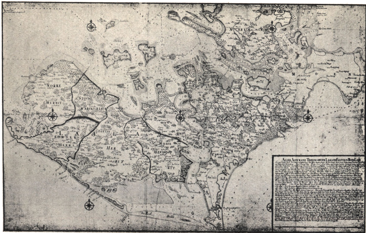
Efter gammelt Kort i Kgl. Bibliotek.