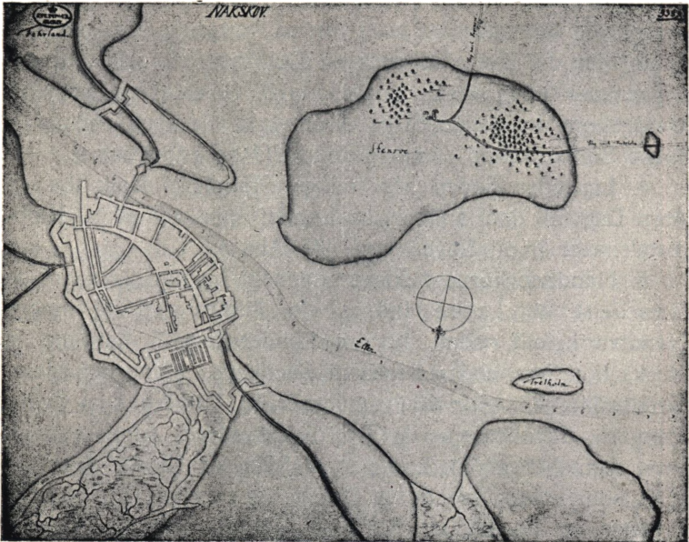
NAKSØV c. 1700. Efter Kort i Nationalmuseets Billedsamling.

Aars Tid har tilføjet de negotierende stor Skade udi deris Handel med det store Landprang, som de begaar, idet de opkøber det meste Korn, som Bonden burte føre til Kiøbstederne at forhandle, under det Skin, at hvis Korn de i saa Maade af Bonden køber, yder han for Skatter eller og for Sæde- eller Laanekorn, hvilket de igien forhandler ved hele Ladningers Udskibning baade til fremmede saavel som til vore egne Skippere; og til sligt at skiule bruger de Forordningen af 1692 den 13 December, som tillader dem, deris egne Gaarders Avling at forhandle til hvem de vil.