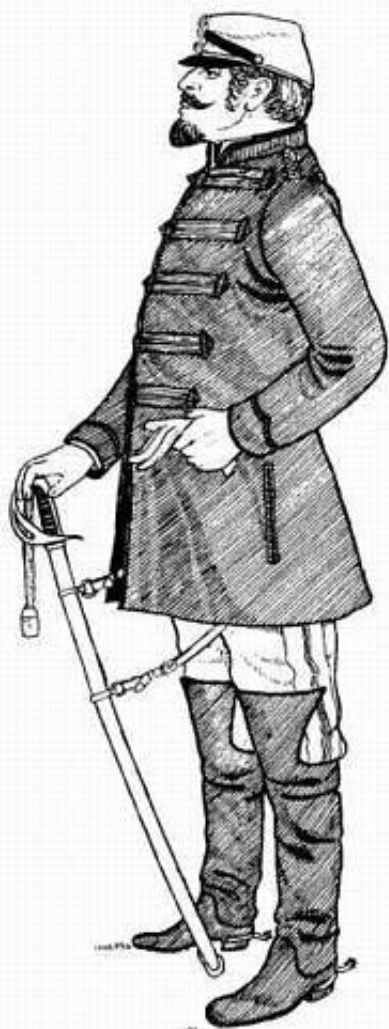
Dansk dragonofficer med ureglementerede lange støvler.

Til patrontasken fastgjordes ladestokken i en rem, der var tilstrækkelig lang til, at denne uden besvær kunne bruges. Sabelgehængen havde en såkaldt S lås.