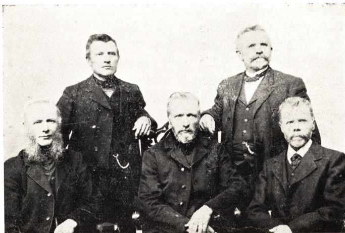
De 5 Brødre af Sneftrupslægten