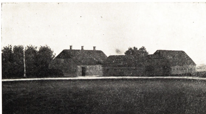
Øster Sneftrup Aar 1857