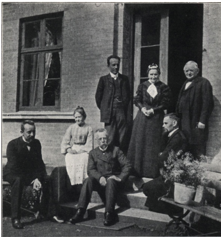
Fra Husby Præstegaard, Sommeren 1907.