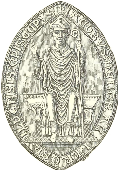
Biskop Jacob Erlandsens Segl, efter et Aftryk fra 1251 i Rigsarchivet.