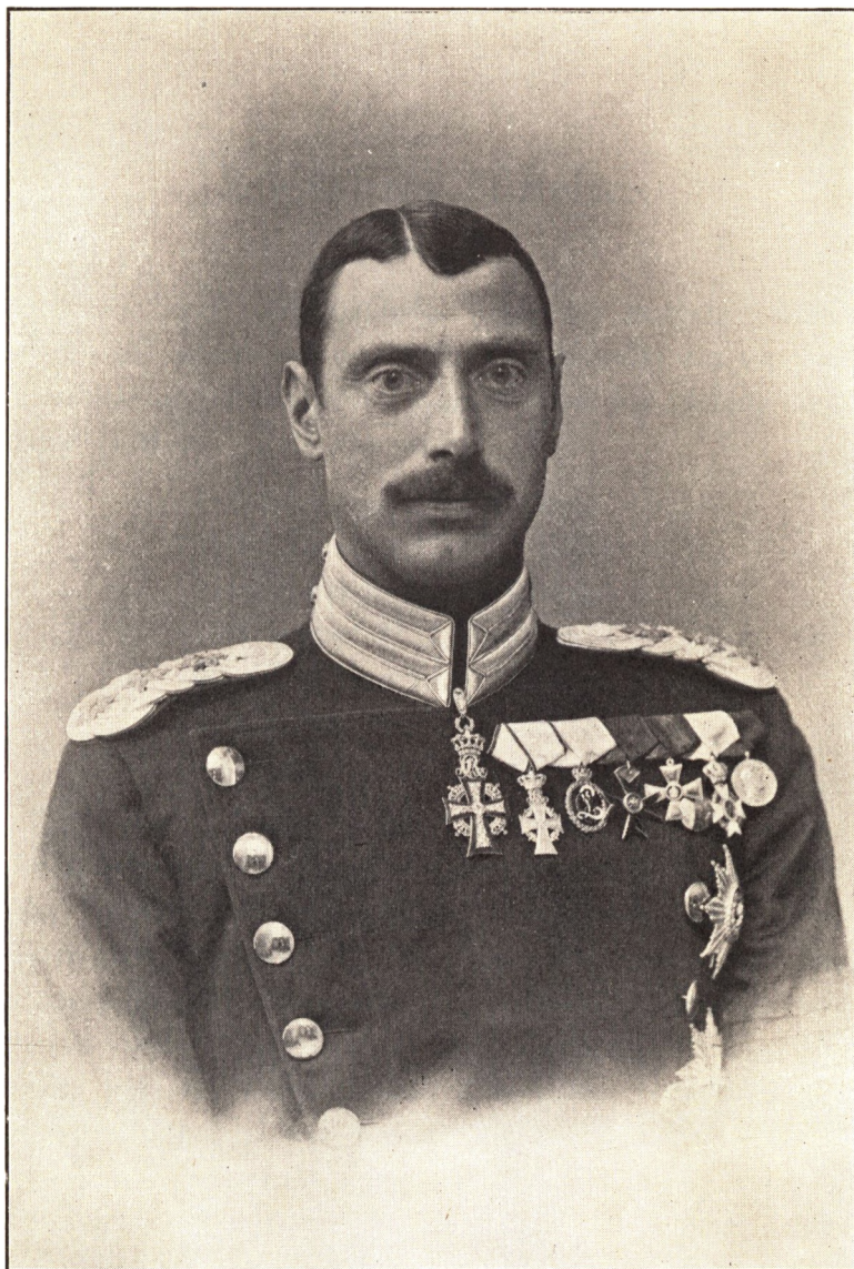
Hs. Majestæt Kong Christian X.

Protector for de sammensluttede danske Forsvarsbrødreelskaber.