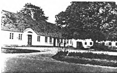
Nørgaard-slægtens gård i Billund i Jægerup sogn ved Haderslev. Fotograferet ca.1960.