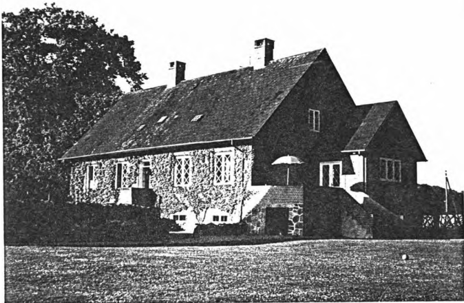
Foto 1956 af "Gartnerboligen" nord for Frijsenborg Slot, her boede Far og Mor fra 1944 til 1968.