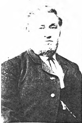
(6) Carl Vilhelm Philipsen Fotograferet Kbhvn. ca.1900. Læs om ham på side 9 her!