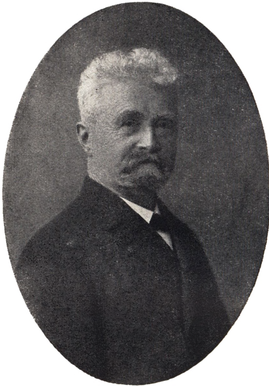
POUL BJERGER 1853 - 6. Februar - 1923