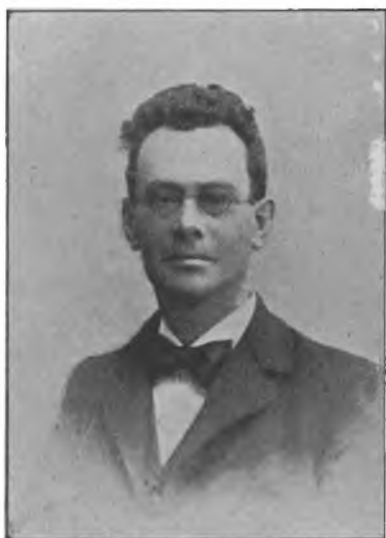
Rigsarkivar, Dr. phil C. F. Bricka.