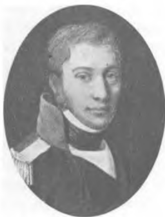
F. L. d'Auchamp, 1776—1847.

François Louis d'Auchamp 1) , født 31. Dec. 1776, kom 1798 til Danmark, anbefalet af Grev Løvendal, der havde kendt ham