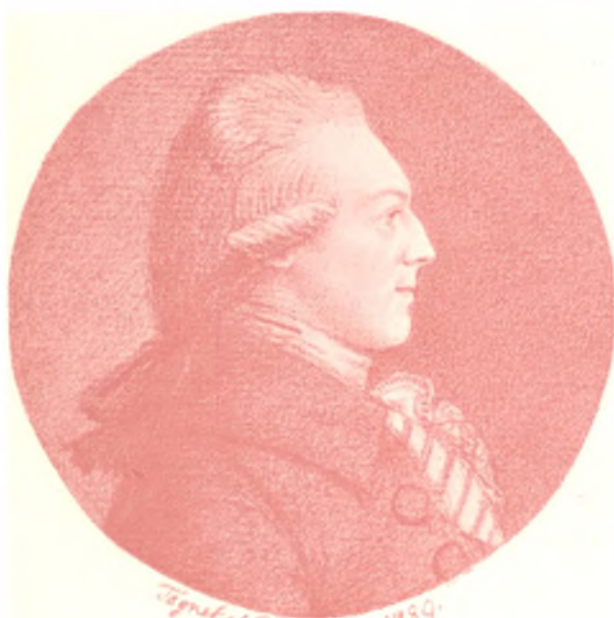
Signet of Paul Spaten 1789