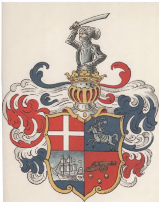
Admiral de Ruijters danske Vaaben efter Adelsbrevet af 1. Aug. 1680 (jfr. S. 137 f.).