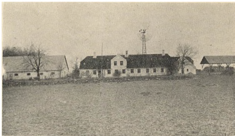
H. Grøntveds Gaard i Mygdal ved Hjørring.

fra 1787. De findes paa Rigsarkivet. Folketællingslisterne fra 1845 er meget værdifulde; her staar bl. a. de forskellige Personers Fødested opnoteret. I Rigsarkivet har man desuden Ekstra-Skattelisterne for de Skatter, som undertiden paalignedes Befolkningen. Dertil kommer saa Lægdsrullerne, Skøde- og Panteprotokollerne, som findes i Lands-Arkiverne. Endelig er der Auktionsprotokollerne, Auktionsdokumenterne og Brandforsikringsprotokollerne. I nogle Tilfælde ogsaa Tingbøgerne. Endelig maa Matrikelbøgerne nævnes; de gaar tilbage til 1600-erne. Og her kan man finde baade Gaard- og Marknavne, foruden Navne paa Fæsterne eller Ejerne af Landejendommene. I Tidsskriftet „Fortid og Nutid“ findes adskillige Vejledninger til Benyttelse af de specielle Arkivsager.