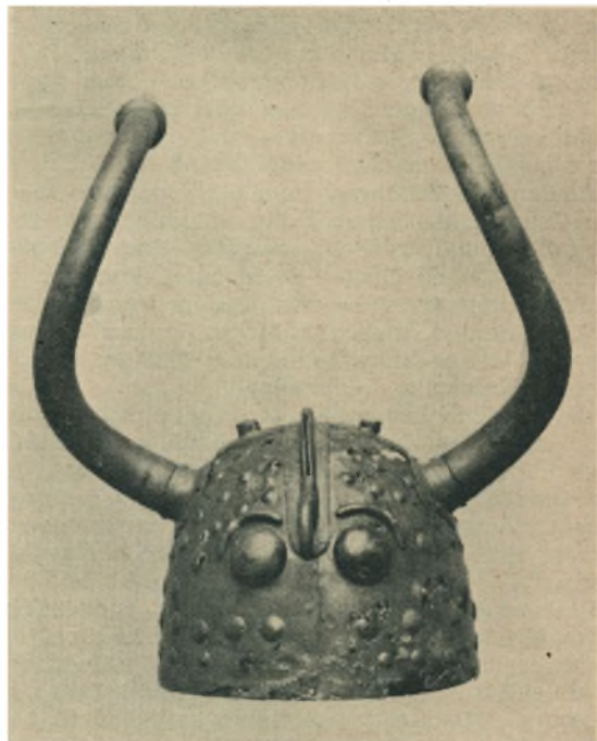
Fig. 2. Den ene af Bronzehjelmene fra Viksø.

Ogsaa Oldsager fra Jernalderen har Tørvegrav-