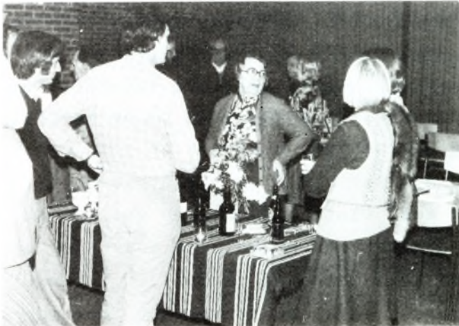
Fra åbningen af udstillingen "Værd at værne".