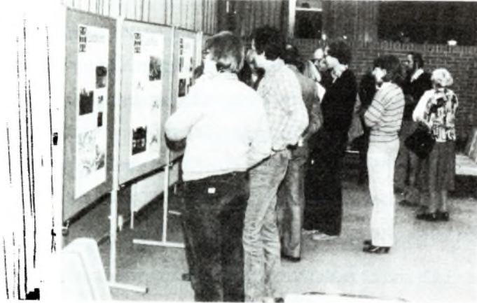
Fra åbningen af udstillingen "Værd at værne".

Endelig vil vi nævne, at skoler eller andre interesserede er velkomne til at låne hele eller dele af udstillingen, som består af 6 plancher.