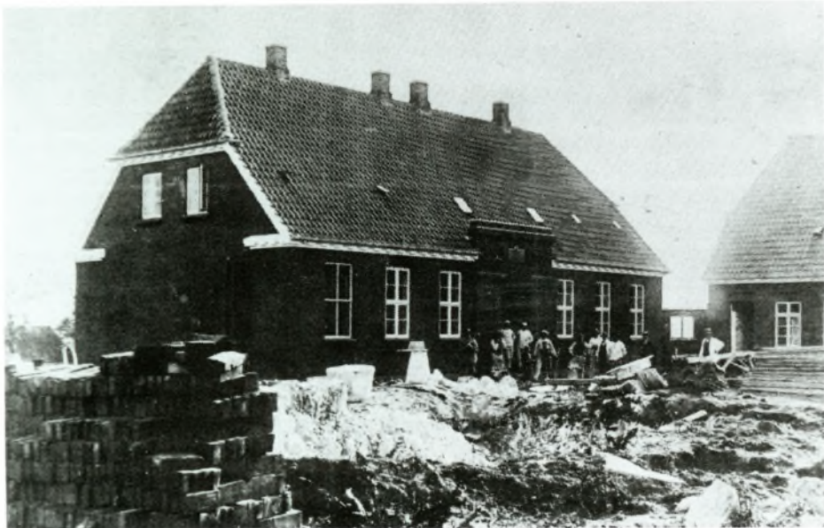
Ledøje skole, bygget 1923-24.