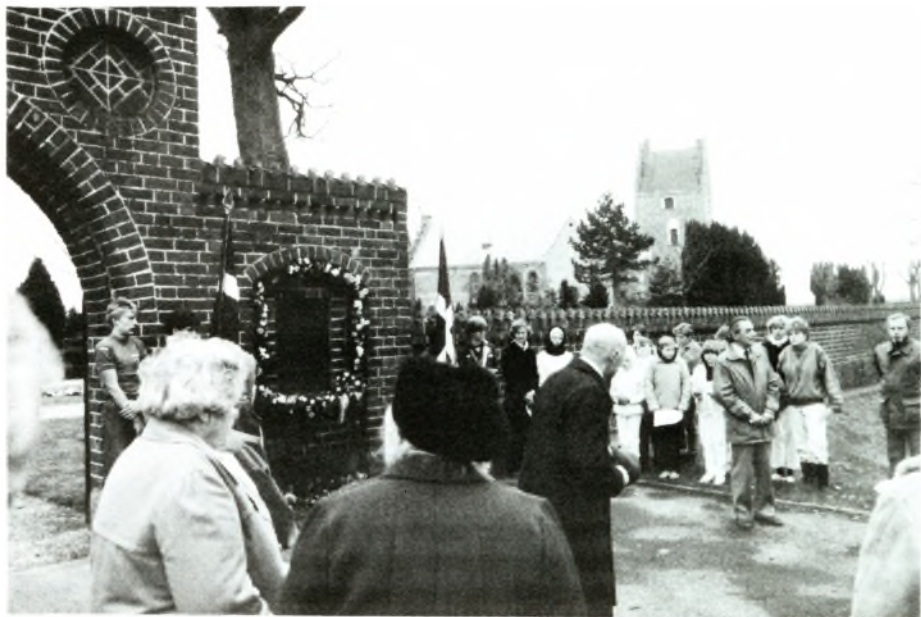
Mindehøjtidelighed ved 5. maj-tavlen i Smørum kirkegårdsmur, 1985.