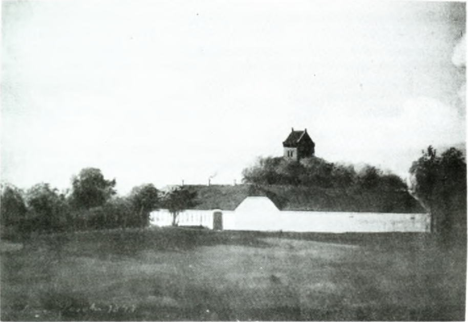
Ledøjegaard, malet af Jacobsen Lerche 1898.

Ledøjegaard lå på Ledøje Søndre Gade, men blev nedrevet efter en brand i 1937.