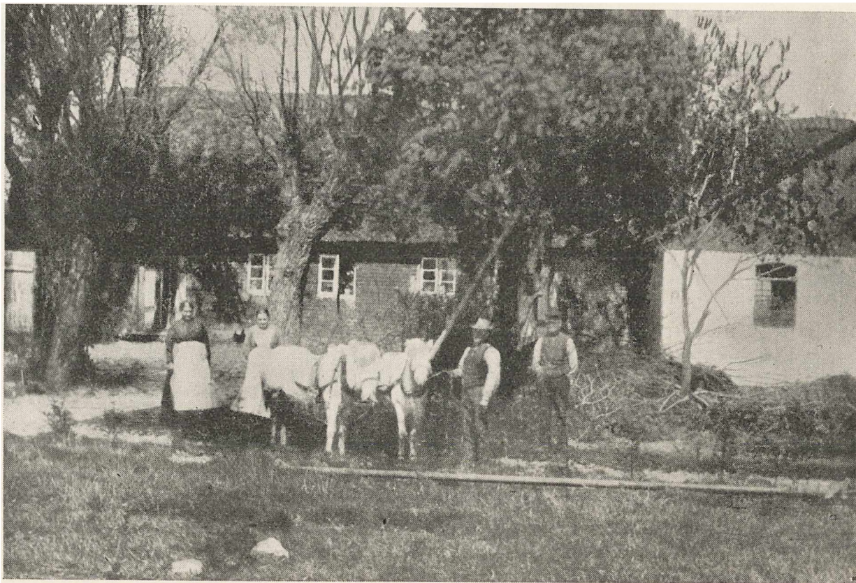
Hjemmet i Dueled som det saa ud for ca. 100 Aar siden. Til venstre i Billedet ses Smedien, hvortil Døren staar aaben.