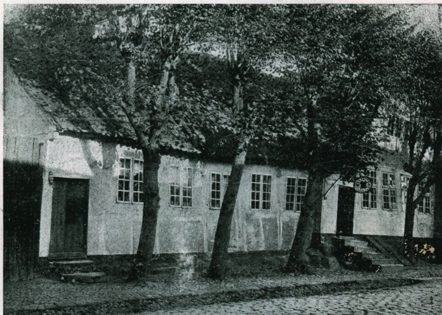
„Den gamle Glarmestergaard“ i Næstved.