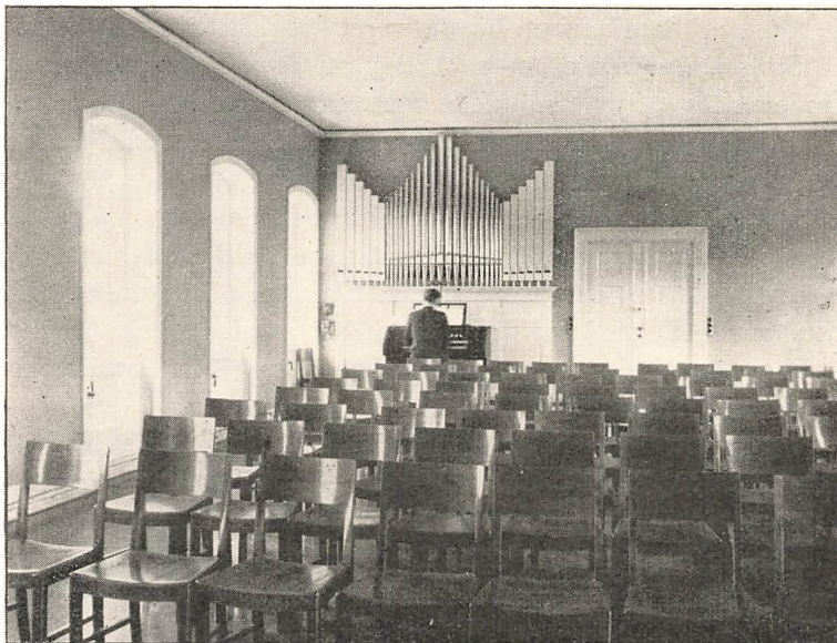
Fest- og Musiksal.

lig er der vel Grund til at fremhæve den store, smukke Bibliotekssal.