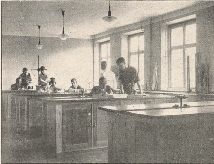
Det fysisk-kemiske Laboratorium.

Myndigheder og Skolemænd og for de tilstedeværende »Venner af Jonstrup« — heriblandt de to norrøne Venner: Islands Bisp og Færøernes Provst.