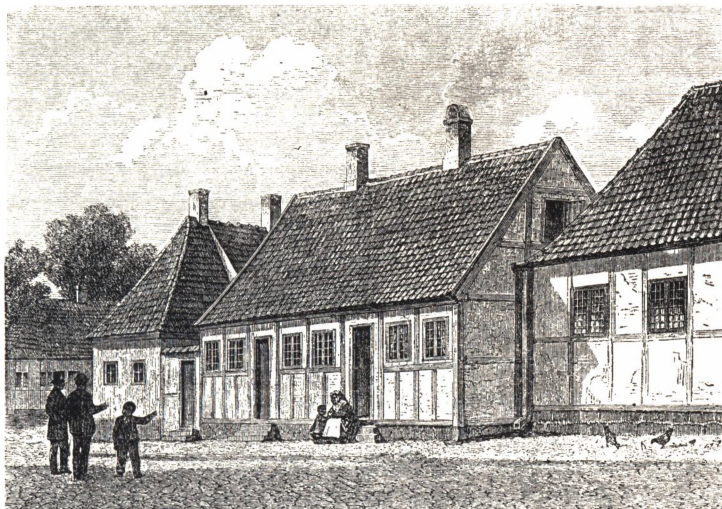
6 C. Andersens Fødehjem i Alnakmøllestræde i Odense