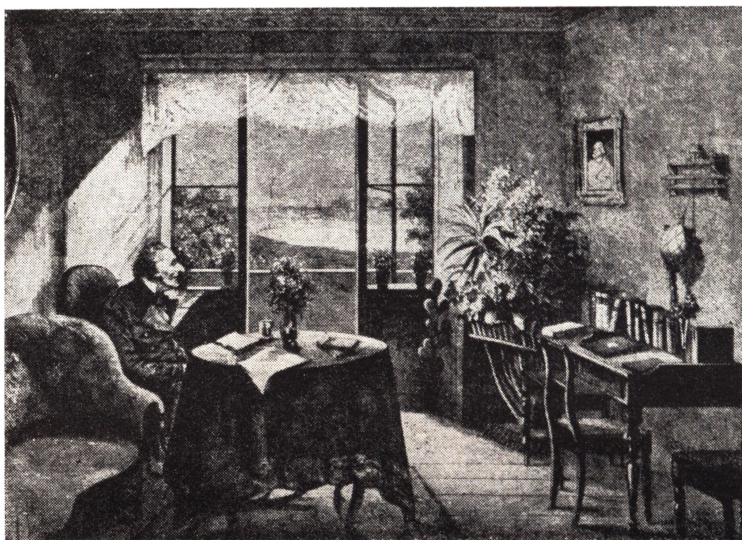
H. C. Andersen i sin Dagligstue hos Familien Melchior paa „Rolighed“.