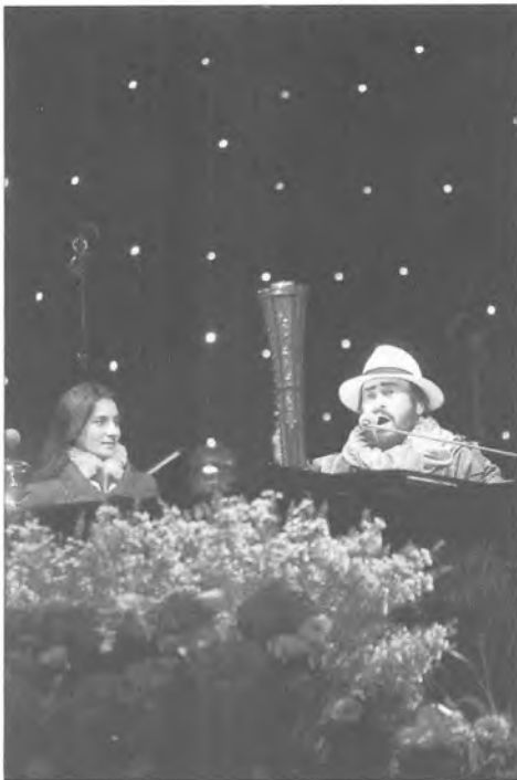
Den verdensberømte tenor Luciano Pavarotti optrådte ved en koncert i Augustenborg Slotspark den 15. september. Efterfølgende blev tenorens præstationer udsat for voldsom kritik i medierne.

behov for at tage temperaturen på sit bagland og derfor (har) ønsket en tilkendegivelse. Måske han ligefrem har ytret et sådant behov for sin indre cirkel af ministre og ordførere. Ved at kigge sig rundt i kredsen var der ikke så mange brugbare og ubelastede tilbage. (...) Tilbage som et naturligt bud stod socialministeren, der i hele sin ministertid har været lige så usynlig som det store regeringspartis sociale samvittighed (...). Under normale omstændigheder beordrer en statsminister ikke en af sine ministre til blot at trække kontroversielle udtalelser i land - ikke såfremt sådanne strider direkte mod en regerings politik og dermed sår tvivl om denne politik. En sådan minister bli-