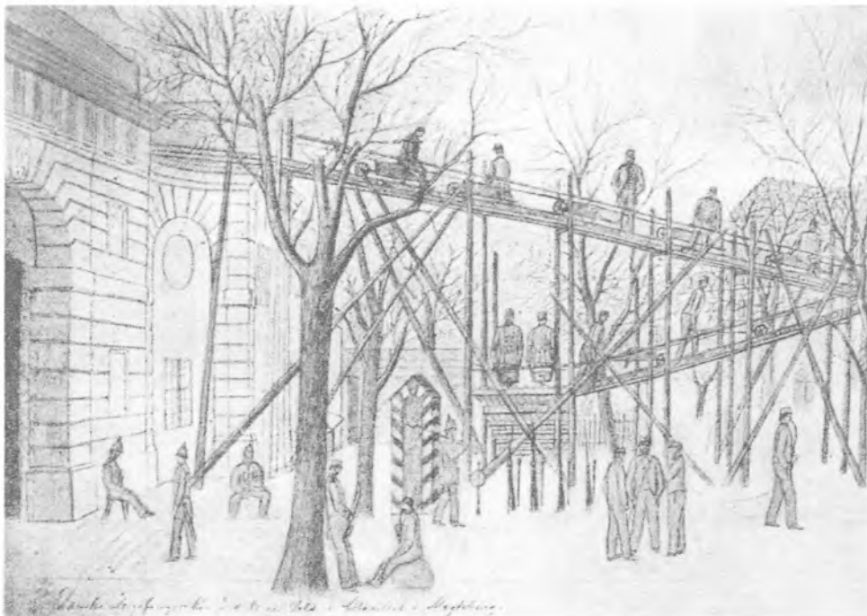
Danske fanger på arbejde i Magdeburg. Stik: Liljefalk og Lütken: »Vor sidste kamp for Sønderjylland«.

Så vidt det kan ses, findes der ingen samlet redegørelse for de danske krigsfangers ophold i østrigsk og preussisk fangenskab, men enkelte bøger og artikler kaster alligevel et godt lys herover. 7)