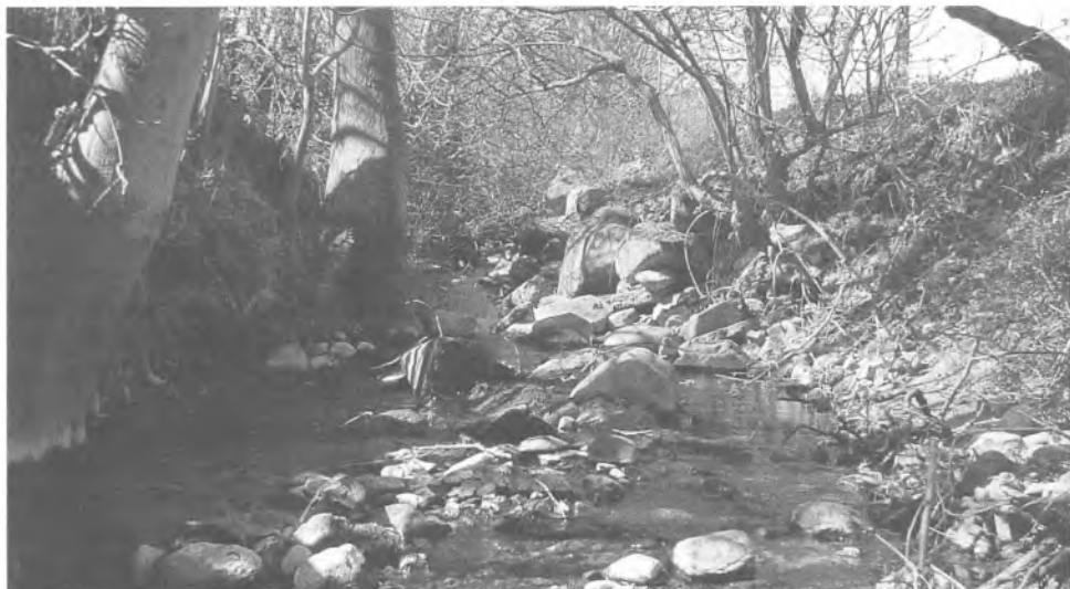
Fig. 6. Resterne af befæstning og sluseværk i Snogbækken, hvor denne tidligere i et næsten vinkelret knæk blev ledt i Hertug Hans' Kanal. Bækken har, efter at forbindelsen til kanalen blev afbrudt, eroderet sig 1,5 til 2 m dybere ned.