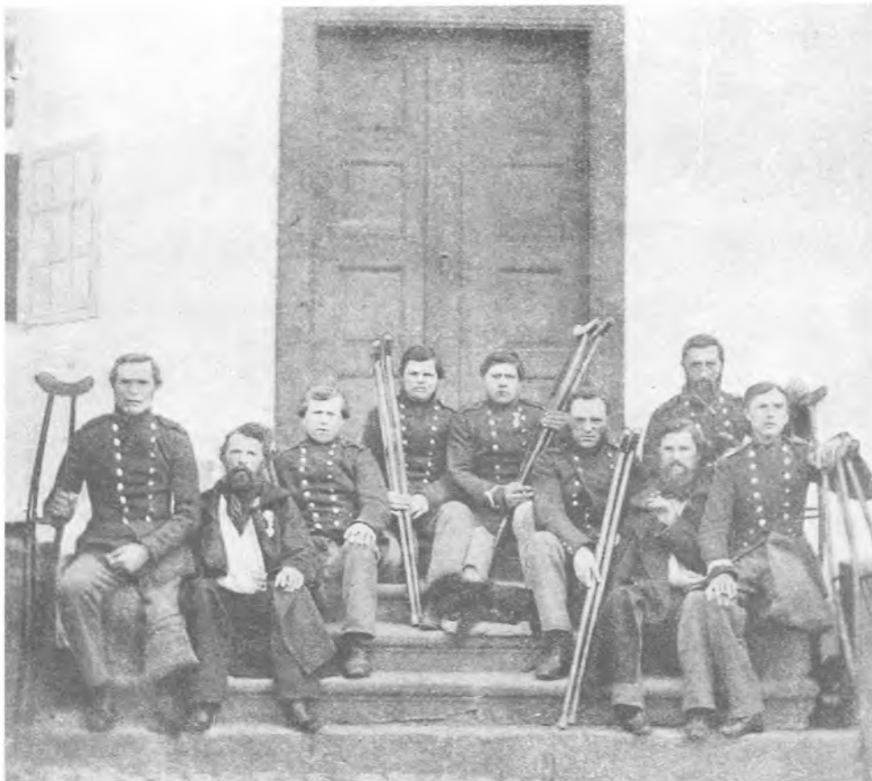
Sårede danske soldater.

Så spillede fjende, med arge hånd De splidens toner fuldgramme Da smededes forsagtheds rustne bånd Om sangbunden med det samme