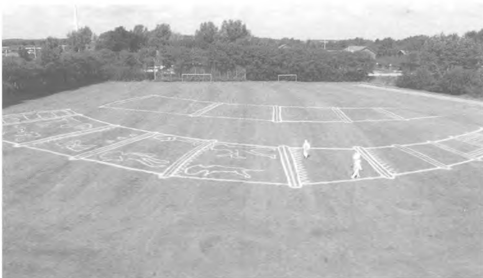
I juli kunne eleverne på kommuneskolen i Tønder opleve dette syn af guldhornene på skolens boldbane. Fire kunstnere fra gruppen Outsize gjorde historien lidt mere levende.

så kritisk, at Skoleforeningen bebudede lukning af tre skoler og sammenlægning af børnehaver. Det var så meget mere alvorligt, som det kuldastede regeringsgrundlag (fra februar) mellem SPD, SSV og De Grønne netop havde taget højde for denne situation. I det nye og gældende regeringsgrundlag (fra marts) mellem CDU og SPD havde socialdemokraterne i løbet af den måned, der var gået mellem de to vedtagelser, givet køb på netop dette punkt, så en ligestilling mellem befordringen til de tyske og danske skoler var udskudt mindst to år.