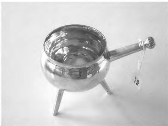
Gregersdorffs stjertpote.

Det var der en god grund til, nemlig hans meget korte produktionsperiode i Tønder og i det hele taget. Hans fødselsdata er ikke kendte; men ifølge »Danske Sølvmærker« stammer han fra byen Slesvig. Den 4. juli 1711 fik han borgerskab i Tønder. Borgerskabet betød, at han kunne nedsætte sig som guldsmed i byen. For de fleste mestres vedkommende falder tidspunktet for erhvervelse af borgerskab