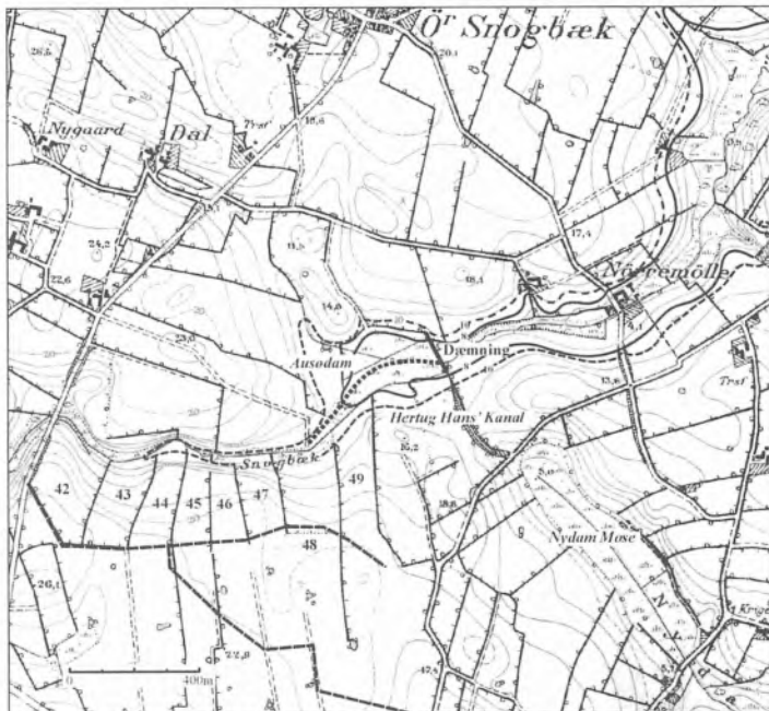
Fig. 1. Udsnit af målebordsblad M 4211 Sottrup fra 1932. På udsnittet er markeret dæmningsanlægget ved østenden af Ausødam, som muliggjorde, at der blev dannet en sø vest for anlægget. Med fed stiplede signatur er skitseret Snogbækkens oprindelige forløb gennem Ausødam. På grundlag af udskiftningskortet fra 1782 over Sottrup bymark er parcellerne umiddelbart syd for Snogbæk markeret (nr. 42-49), og datidens vejføringer i samme område er også vist (stiplede signatur).

og fortolkninger, som har været publiceret i forskellige lokalhistoriske tidsskrifter, eksempelvis af C. J. Andersen (1965). Senest har N. E. Andersen (2004) og S. Rasmussen (2004) også publiceret bidrag om vandbygningsanlæggenes historie. N. E. Andersen er i to artikler fremkommet med nogle nye anskuelser bl.a. vedrørende mølleteknikken og møllevandets tilvejebringelse. I forbindelse hermed anlægges det synspunkt, at der ved Snogbækkens indløb til Ausødam skulle have været anlagt et stemmeværk med sluse til