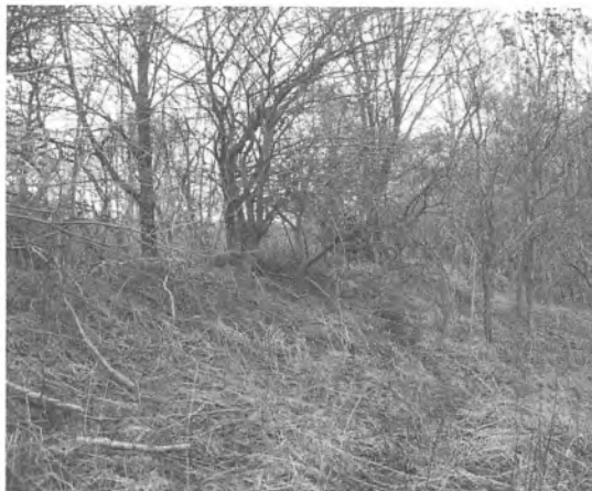
Fig. 3. Dæmningen ved den østlige ende af Ausødam. Toppen af dæmningen ligger 2-2,5 m over niveauet i de centrale dele af Ausødam.

Det vil sige, at da hertug Hans d. Yngre påbegyndte sine vandbygningsarbejder, har Ausødam måske allerede været en sø. Det er så muligt, at hertugen har ladet dæmningen forhøje, så vandet kunne staves op til den højde, som var nødvendig for at give det frit løb ind i den gravede kanal (fig. 2,2). Rester af dæmningen, som oprindeligt har været ca. 100 m lang, ses stadig i terrænet som en ca. 1,5-2 m høj vold (fig. 3). Kornmøllen på Nørremølle lod hertug Hans nedlægge, da møllen på Sandbjerg kom i drift. I en