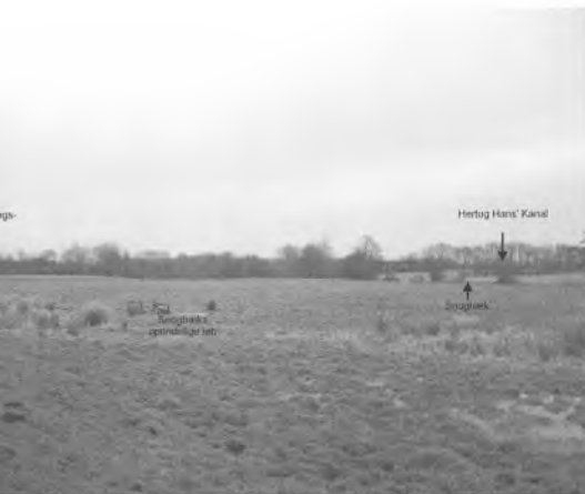
Fig.4. Den laveste og fugtigste del af Ausødambassin set i østlig retning. Her har Snogbækken antageligt haft sit løb, inden dæmningen blev bygget. På grænsen mellem eng og hegn omtrent midt i billedet kan svagt anes et fladt u-formet tværprofil af det oprindelige løb. Lidt til venstre herfor ses en senere anlagt afvandingsgrøft med et mere v-formet tværprofil. Snogbækkens nuværende løb i sydkanten af Ausødambassin anes til højre i billedet og bag denne, flankeret af et højt levende hegn, Hertug Hans' Kanal.

dette ligeledes på, at Ausødambassin har været en sø på dette tidspunkt. På det topografiske kort kan udbredelsen af eng samt højdeangivelserne give et fingerpeg om søens oprindelige størrelse. Niveaumæssigt har søens vandspejl ligget på en kote mellem 8 og 10 m, så søen kan have bredt sig lidt ind i det lave terræn mod nord (se fig.1, hvor 8- og 10-meter højdekurverne er fremhævede). Det er i dag stadigvæk muligt at danne sig et indtryk af, hvor Snogbækken har haft sit løb, inden dæmningen blev anlagt. På grundlag af rekognosceringer i terrænet og oplysninger fra luftfotografier fra 1954 kan løbet omtrentlig fastlægges således, som det er skitseret på fig. 1. Det er her, man træffer den mest fugtige og lavest liggende del af Ausødambassin (fig. 4). I den østlige ende af bassinet kan man endvidere ty-