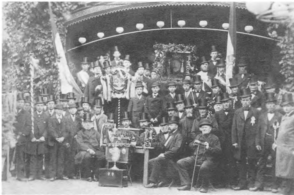
I 1883 kunne murermestrene i Haderslev fejre deres 100 års bestående. I festlighederne deltog murer-svendene, der samme år dannede deres egen fagforening. På billedet ses også murerlærlingene med bowlerhat.

De socialdemokratiske orienterede fagforeninger måtte som SAPD virke i det skjulte. Bismarcks intention med socialistlo-