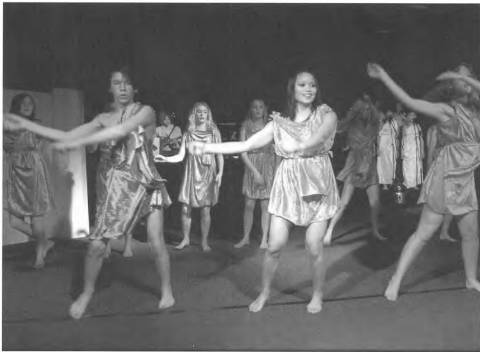
Eleverne på Frøslevvejrens Efterskole opførte i begyndelsen af marts Aristofanes's komedie »Lysistrate« (Kvindernes oprør). Eleverne har brugt det meste af skoleåret til at indøve stykket.