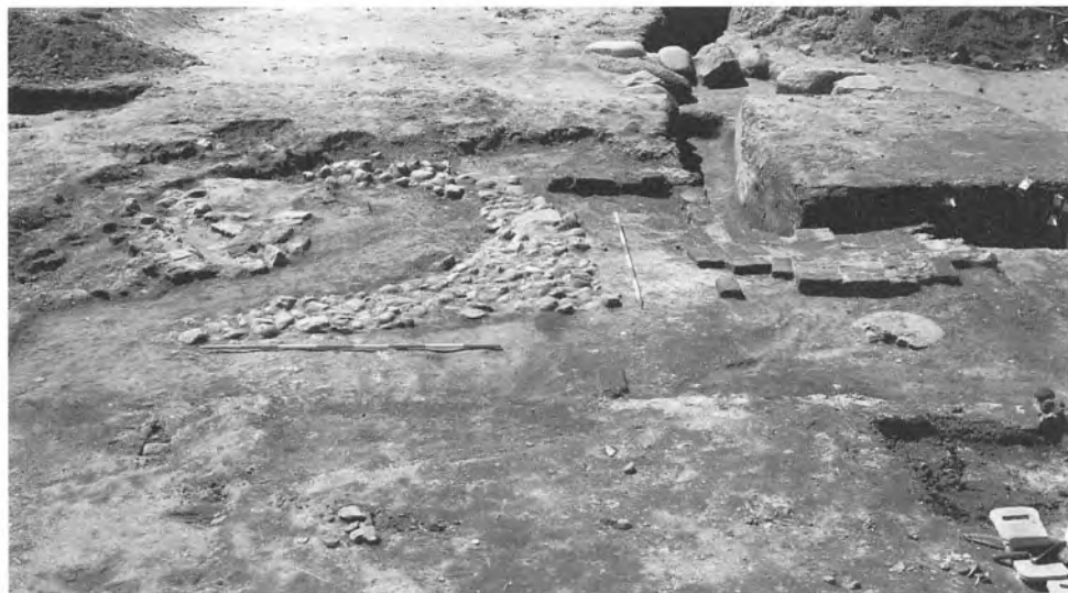
Køkkenet set mod syd. Til venstre i billedet er grundridset af bageovnen og til højre for denne ses teglstensgulvet og umiddelbart foran teglstensgulvet ses den flade sten, hvorpå der kan have stået en søjle, som kan have båret et hvælv. Allerbagerst ses kampestenene til trappetårnsfundamentet.

Det er også vest for ovnen, at rummets bedst bevarede gulvlag er blevet udgravet. Blandt andet lå der her et fint teglstensgulv. Tilsyneladende har teglstensgulvet ikke dækket hele fladen i rummet, men det kan jo være blevet fjernet. Oven på teglstensgulvet lå rester af to slidte mørtelgulve, som meget vel kan have dækket hele rummet, idet der også lå små pletter af mørtelrester i den nordlige del af rummet.