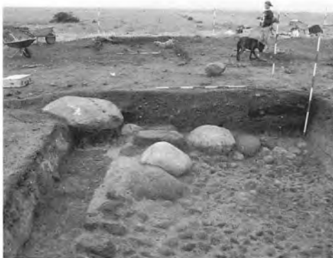
Gulvet i den ældste bygning set mod nord.

Regnskabet indeholder ikke mange oplysninger om borgens udseende, men der omtales dog en lade, som repareres med tegl. Da gården blev nedrevet 1562, nævnes det, at gården omfattede