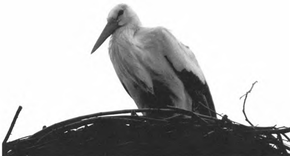
En enlig stork slog sig den 20. marts ned i Rudbøl. Nu venter man blot på en mage.

dustrihistoriske seværdigheder på begge sider af grænsen præsenteres med en tosproget folder (JV).