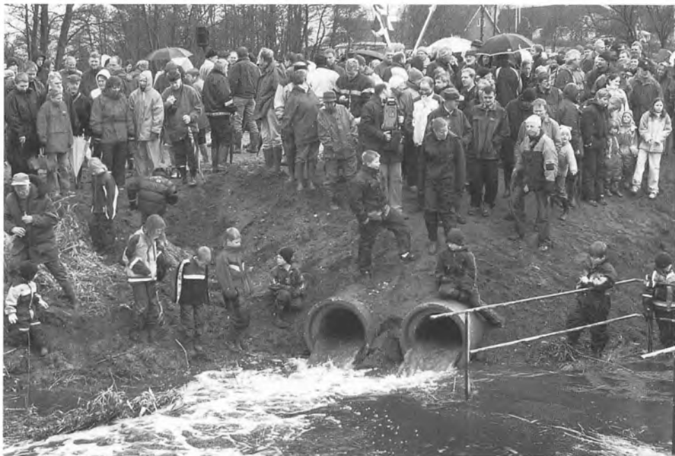
Vandet fosser ud og gendanner derved Slivsø ved Hoptrup, der bliver Sønderjyllands tredjestørste sø. Projektet har kostet 22,4 millioner kr., hvoraf staten betaler 11,5 millioner kr.

11. marts: Det går trægt med indsamlingen til den såkaldte »folkegave« fra Sønderjylland til kronprinsparrets bryllup. Men guldsmed Bent Exner, der skal udføre en rekonstruktion af Frøslevskrinet, arbejder ufortrødent videre (JV).