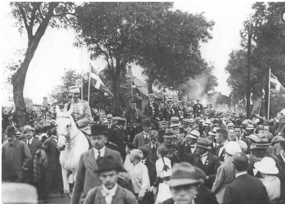
Her få man et indtryk af vejen ved Taps med de mange vejtræer, som nu er ved at blive genskabt.

Bevægelsen ryster kongens mandige skikkelse, den griber en og hver. Voksne mænd græder, de gamle hulker af glæde, mens hyldestråbene med hjerteklang bruser op imod kongen på den hvide hest. Man sporer i råbene, man læser i