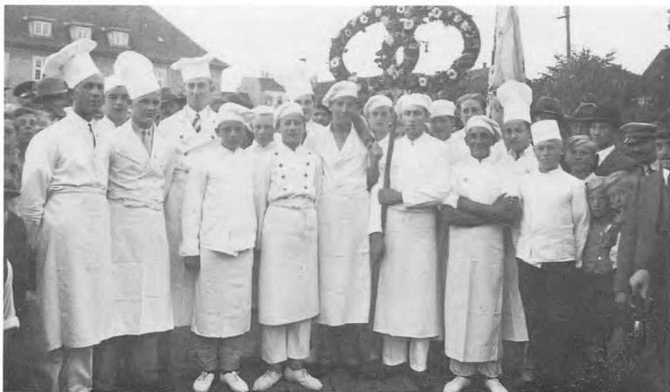
Bagersvendene dannede sammen med mølleriarbejderne allerede før 1914 deres egen fagforening. Billedet viser svende og lærlinge på Gravene ved Fagenes Fest, fotograferet omkring 1930.