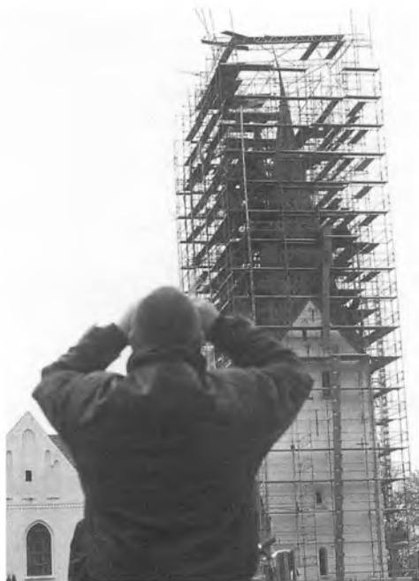
En kraftig storm var i slutningen af marts ved at vælte stilladset omkring Broager kirke, så gudstjenesten måtte aflyses.

ske parti. Klatt sagde i et interview, at han godt var klar over, at det kunne være et problem, men da han blev opfordret til at stille op, havde han gjort det klart, at han ikke ville skifte parti, og i øvrigt mente han, at han måske »var i stand til at overbevise sine partifæller om, at mindretallets interesser også skal varetages.«