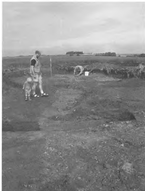
Sandfundament under sydmuren i den yngste bygning, set fra øst mod vest.

En lille bygning, ikke større end 7,5 x 3 meter, er det hidtil ældst erkendte anlæg på stedet. Bygningen var nedgravet ca. 0,50 meter regnet fra den oprindelige jordoverflade og ca. 0,70 meter i forhold til de øvrige anlæg. Gulvet bestod af mindre og sirligt lagte marksten og var bedst bevaret i den nordlige halvdel. Mod vest afgrænsedes gulvet af en række højere liggende mellemstore marksten, som muligvis kan tolkes som en syldstensrække. I det nordvestlige hjørne lå fire store