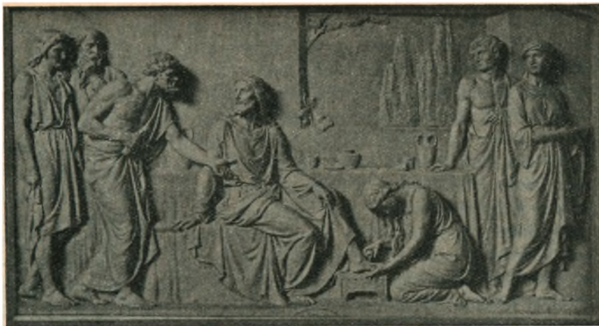
Konkurrence-Arbejde for store Guldmedalje. København 1885. Maria salver Jesu Fødder. Joh. Evgl. 12, 3—8.