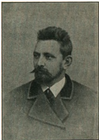
Efter Fotografi fra Københavner-tiden.