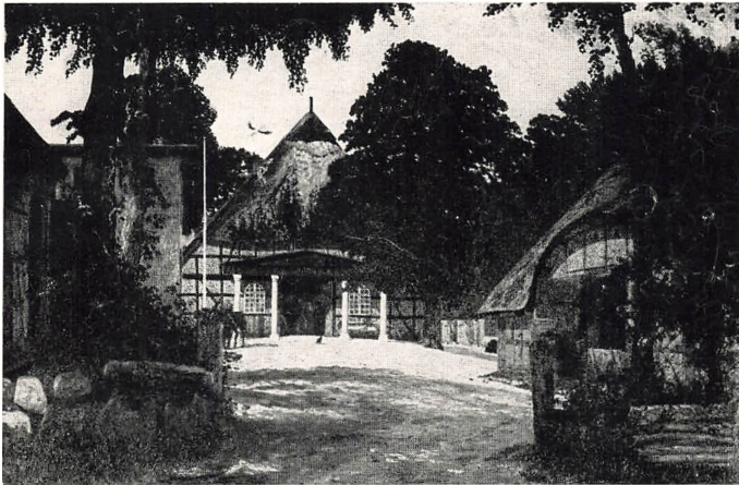
Hof Fernwisch (200 ha) vor dem Brand