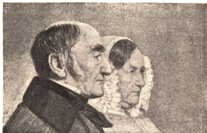
C. N. Rosenkilde og Hustru. Efter Tegning af Gertner.

af følgende. Kort efter at jeg havde debuteret, kom jeg en Formiddag gaaende over Scenen og passerede et Par Herrer, som stod og samtalede. Den ene af dem var Heiberg, der tilkastede mig et Par spøgefulde Ord, hvorpaa jeg svarede i samme Tone. Heiberg vendte sig da til sin Sidemand og sagde leende: «Hun har Mutterwitz efter Faderen! » «Nej,» foer det ud af mig, «efter Modren! »