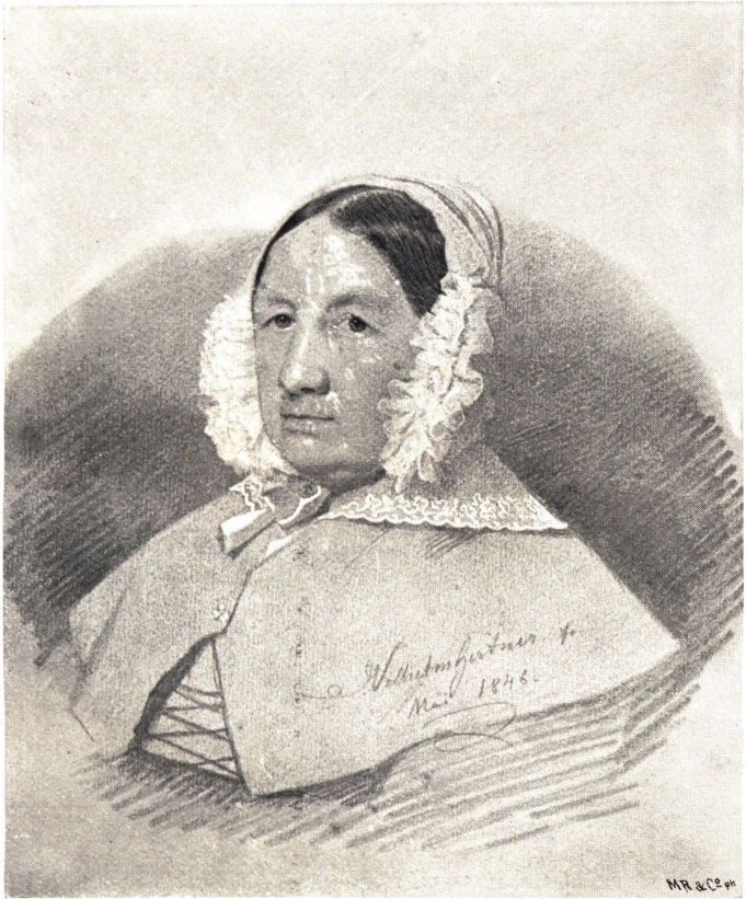
C. N. ROSENKILDES HSTRU.