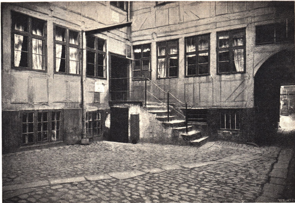
Fra Forgaarden i Ejendommen Adelgade Nr. 77.