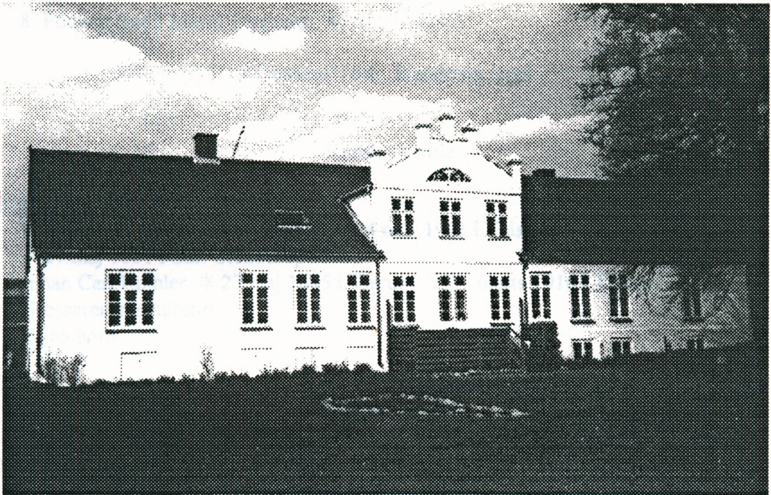
"Dorthealund" ved Sdr Stenderup 1993