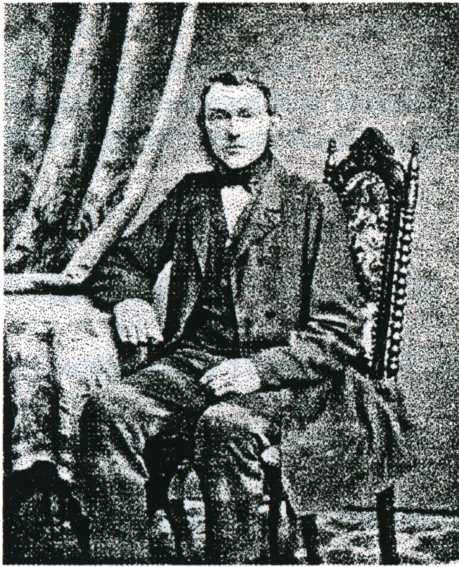
Michel Tonnesen 1831 -