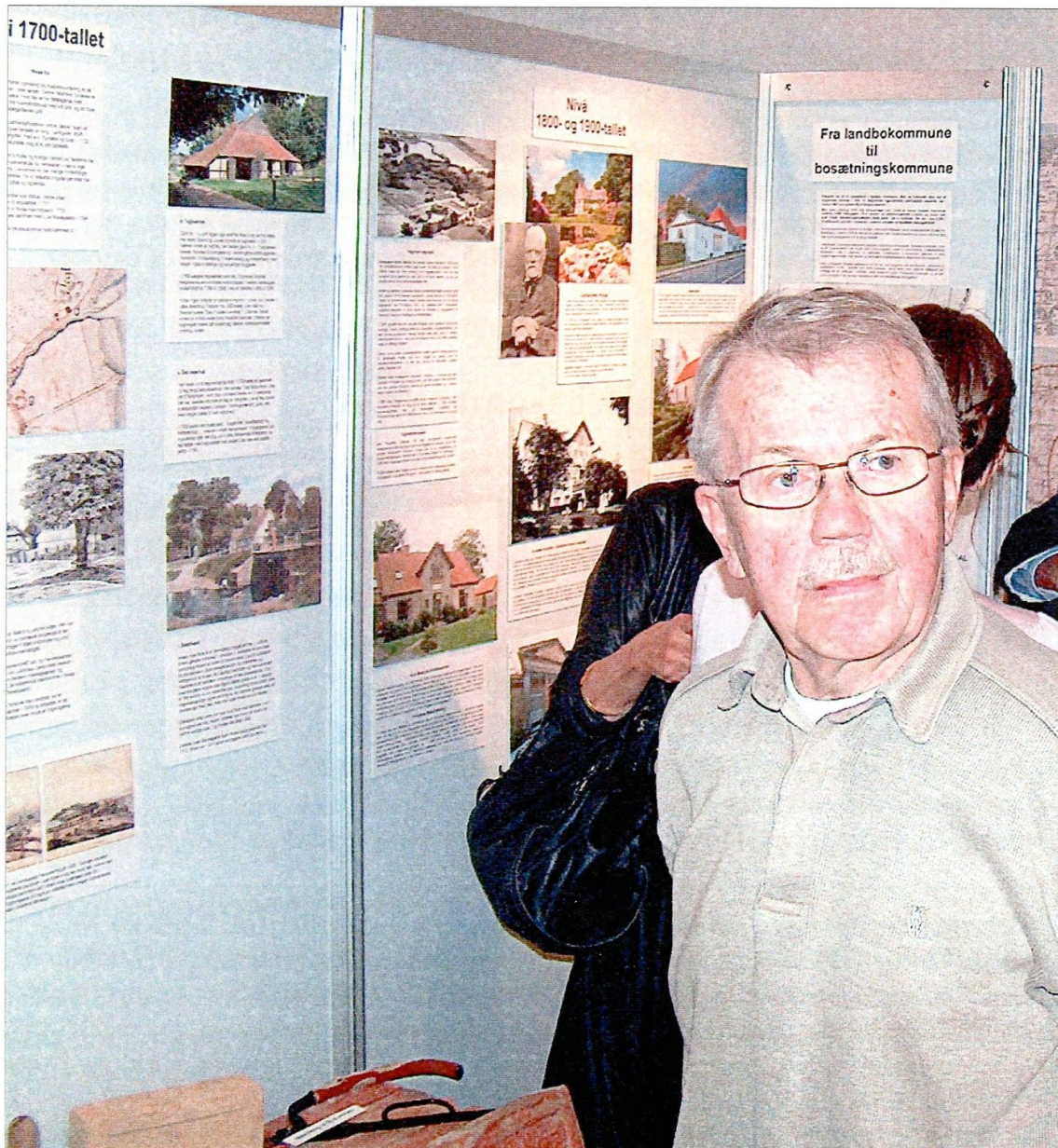
Den nye særudstilling på Fredensborg Lokalhistoriske Museum i Avderød studeres med interesse ved åbningen den 25. februar. (Se omtalen side 2).