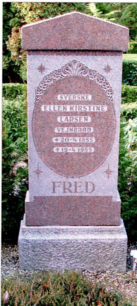
Gravstedet på Nivå Kirkegård. Stenen, der er i håndhugget granit, er ca 1 m høj, ½ m bred og 17 cm tyk. Dertil kommer soklen og topstykket. (Privateje)