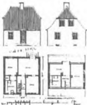
En af Paul Hübners første tegninger til cath. Husbøens i Hamlets Vænge (Husbøens Vænge nr. 15, 16 og 17)

Rigt illustreret værk om Kronborgs riddersal med farvegengivelser af samtlige tilbageværende Kronborg-gobeliner.