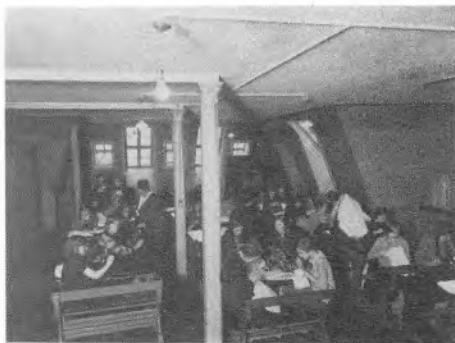
Håndgerning i tagetagen på bygn. IV i 1930. Lo- kalet var i brug fra 1886 til branden i 1967.