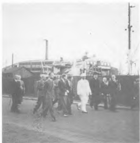
Hermann Göring i Helsingør

både med ærinde til værftet og til de forskellige kulfirmaer på havnen.