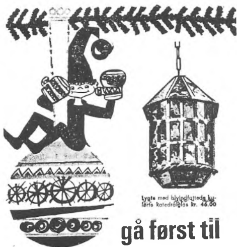
Lyske med blypafstredt lærre katedråløs kr. 46.00

I 1963 kunne Brugsen i Helsingør tilbyde en 2 kg stor juleand for kr. 20,95 og en julestjerne for 2,75. Irma tilbød 300 gram julesylte for 2,48 og 1/2 kg skinke for 4,45. Købmand Nicolai Larsen tilbød en helflaske Diez Ultra Port for 17,85. En flaske Macon rødvin årgang 1959 kunne fås for 9,95 hos købmand Ove Brammer.