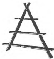
Amagerhylde af teaktræ kr. 20.35