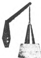
Moderne vægpendel på teaktræsgalge med acrylskærm og kobbertop kr. 29.50