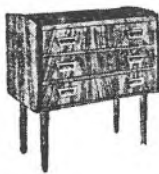
Bestråkket i teaktræ, m. 3 skuffer kr. 137.00