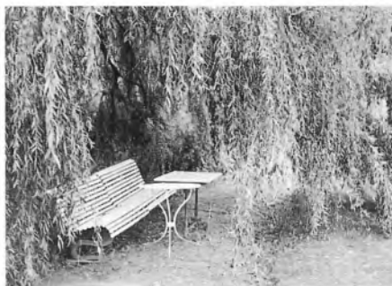
Øverst et stemningsbillede fra Reberbaneparken, der var domineret af piletræer. Nederst ses det gamle hus på Reberbanen, Lundegade 13.