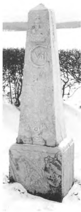
Denne fine hel-milepæl af norsk marmor står ved Kongevejen nær Nyruphus, og her har den stået siden den blev sat op omkring 1780.

Hvem denne tørv har tilhørt, og hvem der har opgravet den, vides ikke. Det er ingen steder omtalt. Da disse mosehuller er mere eller mindre tilgroede, beviser det, at de har været gravede på forskellige tidspunkter, og da kong Valdemar Atterdag i 1339 lod alle kæmpehøjenes store sten i skoven slæbe til grundsten under ringmuren på Gurre Slot, kan det godt tænkes, at han også har taget tørv her til brænding af murens munkesten. Leret dertil skal have været taget i anlæget ved Valdemarslund, men her findes ingen steder, hvor der har været gravet tørv til brændingen.